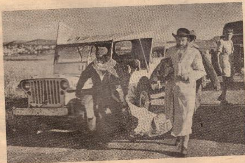
בן ירושלים חוזר מהשבי מרבית-עמון.

שעת ביקח השמשות. אנשים ממחרים לבתי כנסיות, לקבלת שבת מלכתא. השבת הי ראשונה בלי האנגלים. השמש שוקעת, הי כוכבים יוצאים אחד אחד, ומכסים את הי שמים. קול יריה בודדת פולח את האויר. מאיוז עמדה גורתה יריה זו? לא ידוע. מעמדה יהודית ודאי שלא. הכדור הוא כאן מצרד חיוני, סופרים ומונים אותו כזהב טהור. וכמות הכדורים שברשותנו, אינה