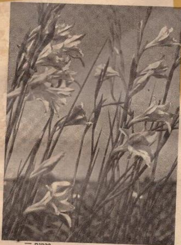
פרחים — נקודות יחן במרחבים.

דו-שבועון לילדים ולנוער ברוח התורה והמסורה