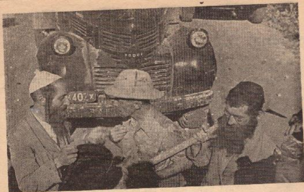
בתפילה ובמלחמה עוסקים בני ירושלים.

כאשר הורגלנו לראות אותם עד כה, הם לוחמים בטקטיקה צבאית, ובשיטות חד- (המשך בעמוד 10)