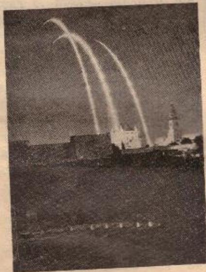
והיא... מופנות יומם ולילה.

כאשר הורגלנו לראות אותם עד כה, הם לוחמים בטקטיקה צבאית, ובשיטות חד- (המשך בעמוד 10)