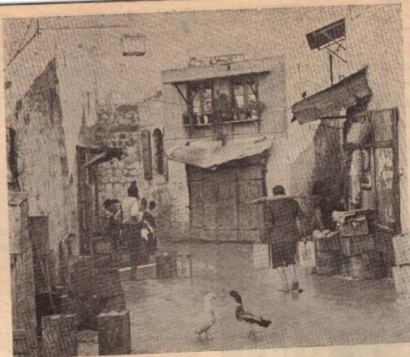
השקט שלפני הסערה — סמטה ברבע היהודי של העיר העתיקה.