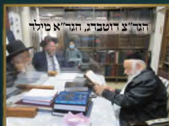
הגר"צ דוטברג, הגר"א מילר