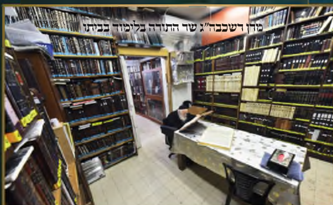
מדין רשכבה"ג שד התורה בלימוד בביתו