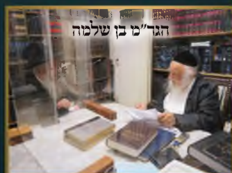
הגר"מ"מ בן שלמה