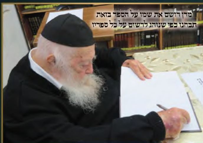
מדין רושם את שמו על הספר בזאת תבחנו כפי שנוהג לרשום על כל ספריו

עלון מס. 27 | טבת תשפ"א | יו"ל ע"י מערכת "קובץ גליונות" | k.gilyonot@gmail.com