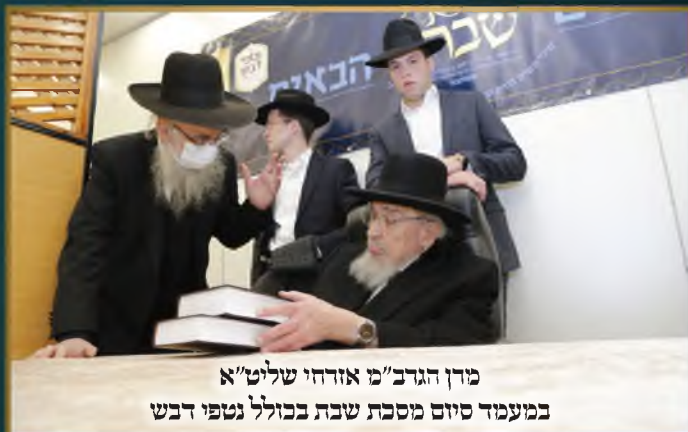
מדין הגר"מ אורחי שליט"א במעמד סיום מסכת שבת בכולל נטפי דבש