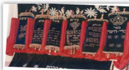
ספרי הכתובים החדשים שהושלמו.