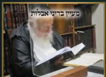
מעין דינוי אכלות