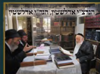
הגר"צ"א אדלשטין, הגר"א אדלשטין