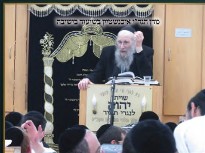
מרן הגר"י איכנשטיין בשיעור בשיבה