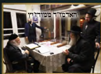
הגר"מ ד' ממוה"ז'ין