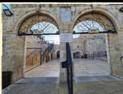
קבר התנא רבי שמעון בר יוחאי