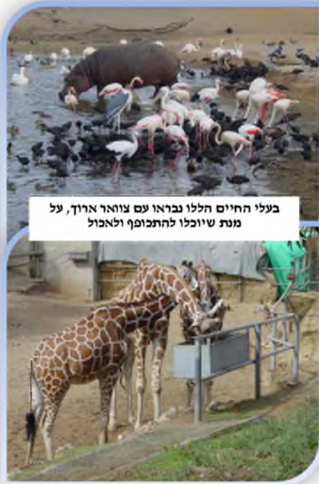
בעלי החיים הללו נבראו עם צוואר ארוך, על מנת שיוכלו להתכופף ולאכול

כלפי הארץ, כמו יתר בעלי החיים, ואילו האדם הולך בקומה זקופה? התשובה לכך היא פשוטה. "האדם שהוא מבחר היצורים לרום חשיבותו, כי הוא מיועד לגדולות לעבוד ליוצרו והוא תכלית כל הבריאה כולה, לכן נברא בקומה זקופה". גם בענין צורת האכילה של בעלי החיים כותב הסטייפלער שיש חוכמה נפלאה, וצריך רק לפקוח את העיניים ולהתבונן בה. כל בעלי החיים שאכילתם היא דרך לקיטה מן הארץ, נבראו בצוואר ארוך כפי מידתם באופן כזה שהצוואר בצירוף אורך הראש מגיע לארץ בקלות, אבל האדם שאכילתו היא על ידי הבאת האוכל בידי לפיו, נברא בצוואר קצר רק כדי שיוכל לסובב ראשו לצדדין, ותו לא, כי ביותר מזה אין לו צורך, וכל יתר כנטול דמי', והשי"ת עשה את האדם מדורד ושקול כפי תכליתו ותועלתו, לא פחות ולא יותר". ואם הבנו את זה, אפשר להמשיך הלאה.