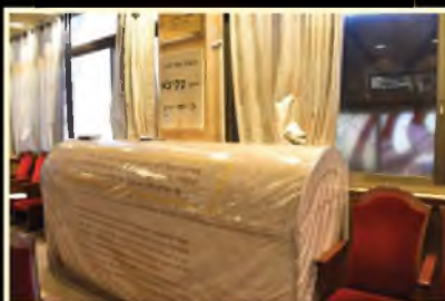
קבר התנא רבי עקיבא