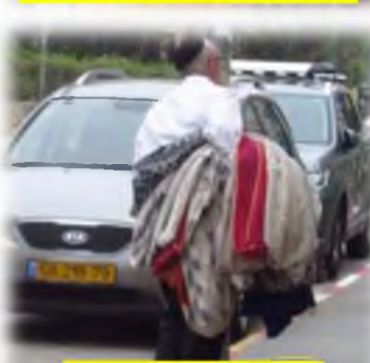
נושא על גבו את המגבות של בית הכנסת, לכיבוש

נפטר להעביר מבלינסון לסגולה'. והאיש הזה לא חושב לרגע; 'כמה דקות ואני שם.. ואדהכי-והכי הנה הוא כבר שם..