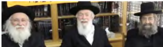
כאשר אנחנו עוסקים בנצחיותה של תורת קדשנו, נעלה על נס את העובדה שבמשך עשרות שנות קיומה של רמת אלחנן אנחנו חיים ונושמים לאורם של מאורי-דרבנו, שלושת גדולי התורה המאירים את נתיבותינו בנתיבות הנצח. 'הרב אמר' ברמת אלחנן זה כמו שאמרנו 'תורת הנצח אמרה'! יהא רעוה מקמי שמיא שזנכה עוד שנים רבות ליתנות ממאור-תורות של שלושת הרבנים, ולקבל יחד איתם את פני משיח-צדקנו

אז הנה הפתרון הפשוט... עורכים הצבעה על שינוי החוק... איזה יופי! מי אומר שהחוק הקודם הוא הנכון?... הנה, בהצבעתנו הנוכחית, נוכיח לכולם שהחוק החדש הוא יהיה המקובל יותר, ההגיוני יותר.