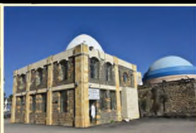
קבר התנא רבי מאיר בעל הנס