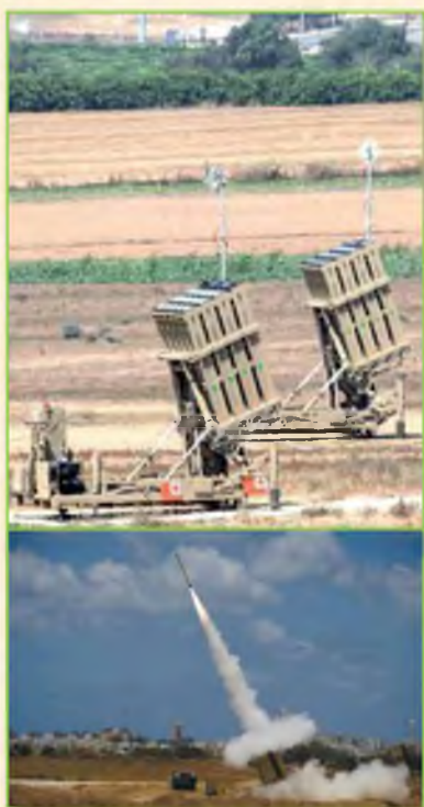
למעלה: מערכת 'כיפת ברזל'; למטה: טיל היוצא מהמערכת בדרך לנטרולו של טיל שיצא מעזה

ובזכות שמירת השבת, ניצלו רבבות התושבים מאסון גדול.