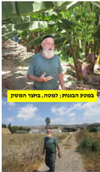
במסע הבנות; למטה, בחצר המשק

של הרבצת התורה בישיבתו, מקדיש זמן רב מסדר-יומו העמוס לצרכיה של רמת אלחנן, ומוציא-ומביא את כל ענייניה במסירות ובנאמנות אין קץ, תוך שהוא עושה זאת בחוכמה ובתבונה מופלאה, ועוקף את כל המכשולים הציבוריים והאישיים. בכל הפרויקטים שעלו-ובאו ברמת אלחנן, הרב פולק תמיד בא-בדברים עם גִבָּאי כל בתי הכנסיות בשכונתו, שומע את דעתם, מאזין ומתייעץ, ובסופו של דבר עושה כפי שמורים גדולי התורה המכהנים-בקודש כרבני השכונה.