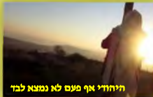
יִהְיֶה אִם מֵעַם לֹא נִמְצָא לְבָד

האם אנחנו מלאכים שבכוחנו להישאר ביישוב-הדעת ובניחותה גם כשהילדים הקטנים מקפצים עלינו, ומחפשים שנסיע בעדם ונעניק להם עצות מחוכמות מה לעשות, וכיצד להפג את מפלסי המתח והחרדה העוברים עליהם? הרי הם, ואנחנו, שומעים כל היום על האסונות הקשים, על פטירתם בטרם-עת של רבים וטובים, מרביצי תורה ויראה, גדולי-חסידות; כאן שומעים על עוד חולה מונשם ומורדם, שרק תמול-שלושם דיברנו איתו, וכאן שומעים על אנשי מסחר ובתי-עסק שקרסו, והותירו את בעליהם ללא פרוטה, מה שהפך אותם במחי-רגע לעניים ודלים!