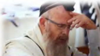
וחי חיי אצילות. ברגע של חשבון נפש

בהזדמנות זו נברך מקרב-לב את האלמנה שתחי', ואת כל בני המשפחה הרוממה, לאירוסי הבן דוד שיחי' עב"ג למשפחת שטיינהרטר מפתח תקוה.