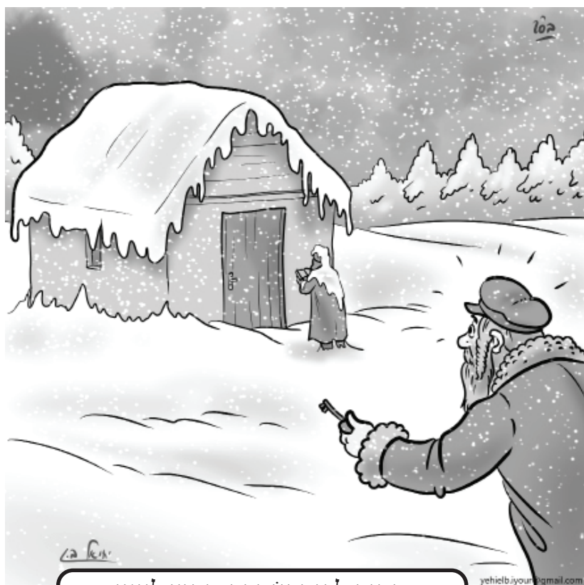
דמות לבנה עומדת מחוץ לציון

קופאים? ! אז הוא ענה: "הגעתי לפנות בקר לציון וראיתי שהציון סגור, וחשבתי אני לא עוזב את הציון של רבנו; כמו שאחרי פטירתו כשאגיע למעלה לשמים, אבקש שאני רוצה ללכת להיכל של רבנו הקדוש בגן עדן, אז אני לא רוצה שיידחו אותי בתירוץ: "יורד גשם, יורד שלג, זה רחוק, קר' וכדומה, אני יגיד למלאכים שפשתייני חי לא הסתכלתי על תרועים, כל יום הייתי בציון של רבנו הקדוש, אז גם עכשו אני רוצה ללכת לרבנו הקדוש בלי תרועים - ואז יהיו חייבים להרשות לי ללכת לרבנו".