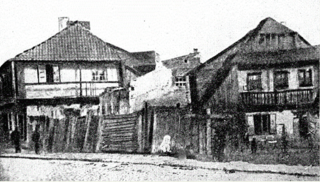
בית המדרש בקאצק

פעם הסביר החי' הרי"מ את היראה הגדולה שהיתה אצלו, בהביאו את דברי חז"ל במסכת ראש השנה (יז.) המדברים בגנותו של מי שמטיל אימתו על הציבור שלא