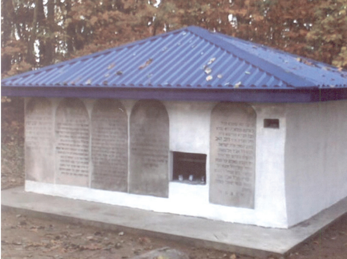
ציון רבינו 'השרף' זי"ע בקאצק ובניו הקדושים זי"ע

לשם שמים, ואמר: "א דער רבי פון קאצק האט יא מטיל אימה גיוועזען, איז גיוועזען לשם שמים" [ואם תשאלו, והלוא הרבי מקאצק כן הטיל אימה על הציבור, אך היתה זו אימה לשם שמים].