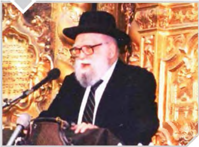
"כ"י תקנ"ה עבד עבד" (שמות כ"א, ב')