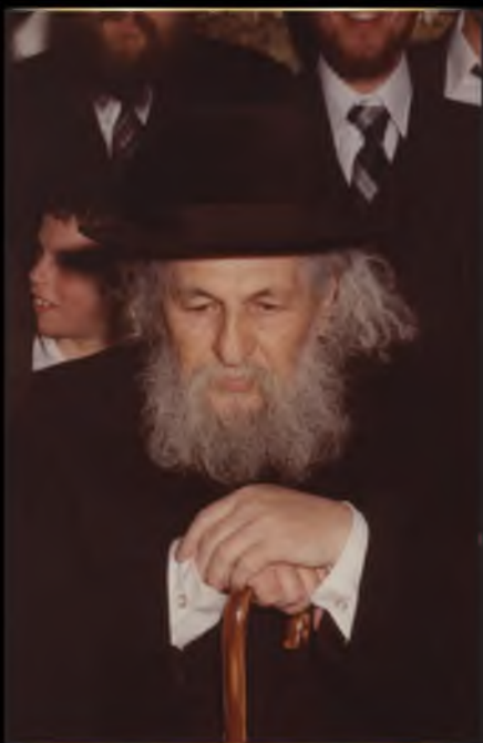
הגאון הגדול ראש ישיבת בריסק רבי יוסף דב הלוי בהגמ"ר יצחק זאב סולוביצ'יק זצוק"ל במלאת 40 שנה להסתלקותו נלב"ע ב' אדר תשמ"א תנצב"ה