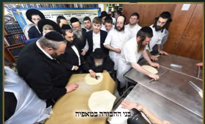
בני החבורה במאפייה