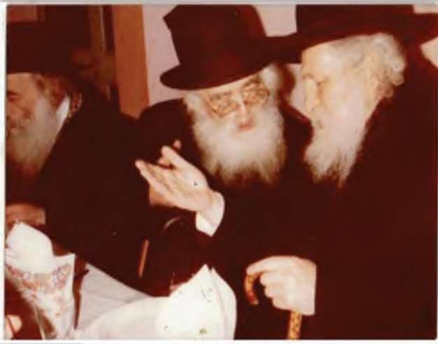
עם מרן הגרמ"ש זצ"ל מרן הגר"מ פיינשטיין באיתנות יב"א מרן הגר"מ פיינשטיין שליטא

מחמירים, שאמר לו מרן זיע"א שאינו מחמיר אלא שמפחד להכשל באיסור, והחומרא זה גדר לא להכנס למקום העבירה ועל ידי כך לא להכשל באיסור.