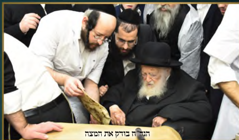
הגר"ח בודק את המצה