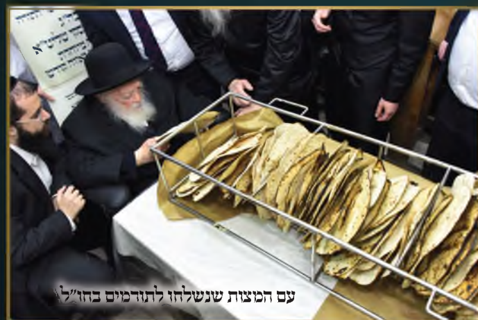
עם המצות שנשלחו לתורמים בחו"ל