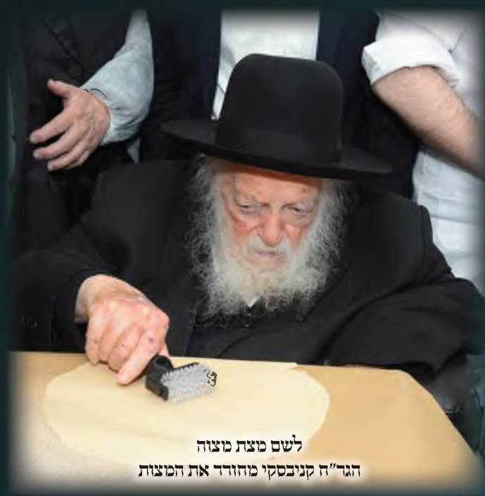
לשם מצת מוצה הגר"ח קניבסקי מחזיר את המצות