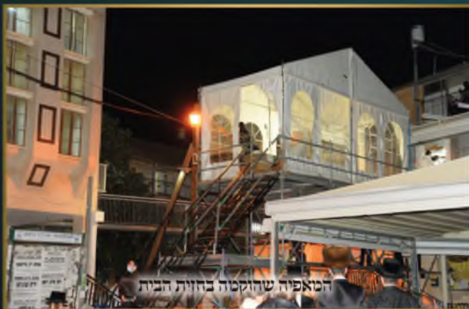
המאפייה שהוקמה בחזית הבית