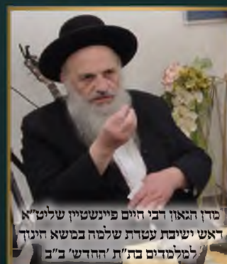
מרן הגאון רבי חיים פיינשטיין שליט"א ראש ישיבת עטרת שלמה במשא חינוך למלמדים בת"ת 'החדש' ב"ב