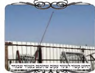
החוט קשור לצינור עקום שהוכנס כעמוד שבגדר

בנוסף להוצאת השדות מהעירוב, היו גם מקומות שהיו בעיות אחרות, כגון עמוד שהתעקם מאוד, ועמוד שהקיפו אותו בגדר של אחת החצרות,