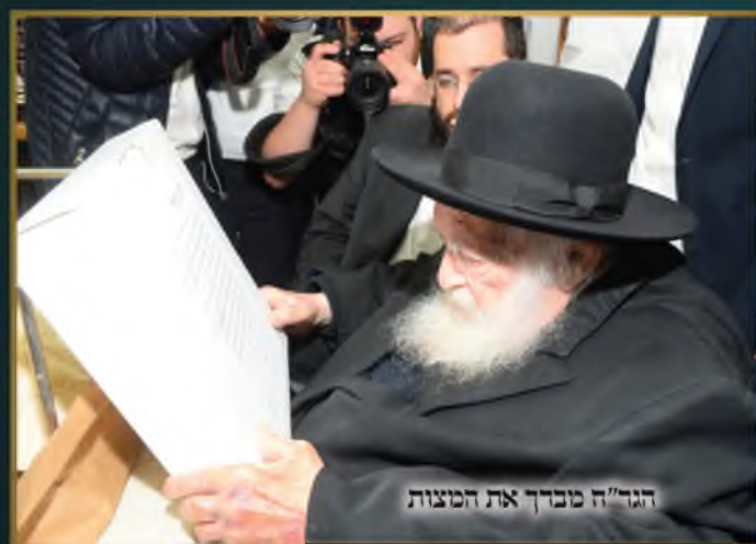
הגר"ח מברך את המצות