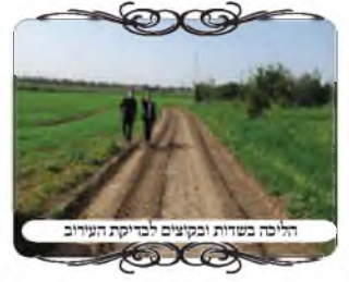
הליכה בשדות ובקוצים לבדיקת העירוב