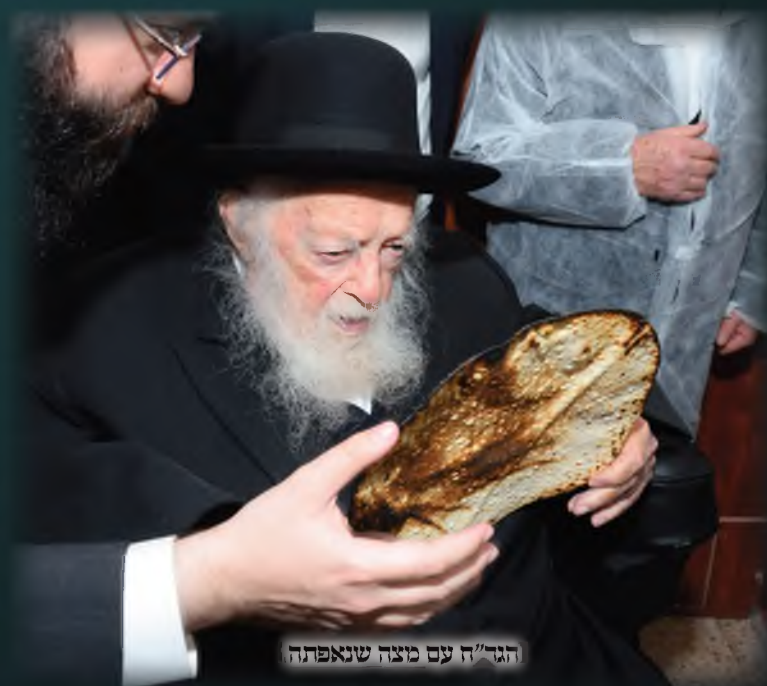
הגר"ח עם מצה שנאפתה