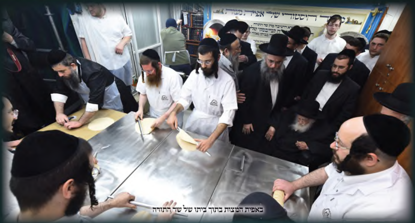
באפיית המצות בתוך ביתו של שר התורה