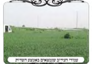
עמודי העירוב שנוצאים באמצע השדות