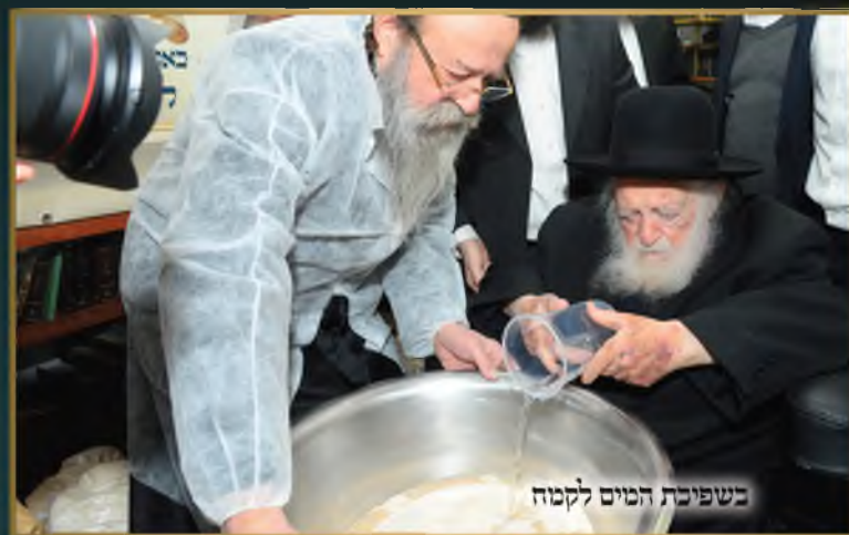
בשפיכת המים לקמח