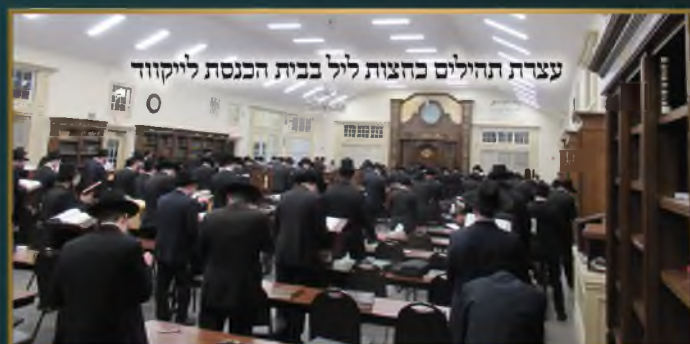
עצרת תחילים כחצות ליל בבית הכנסת ליוקווד