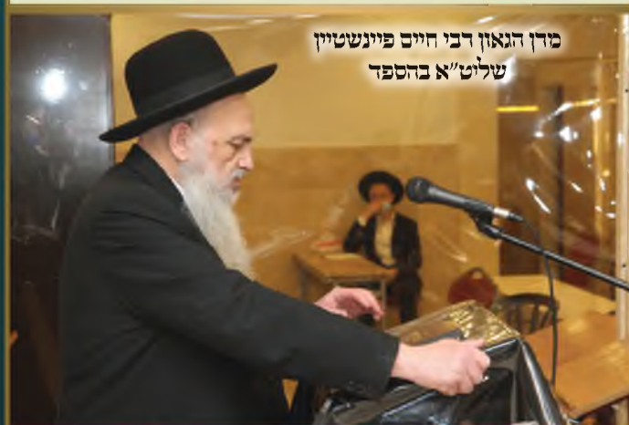
מרדכי הגאון רבי חיים פיינשטיין שליט"א בהספד