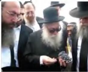
מרן הגר"נ זצ"ל בכרם ענבים שבפיקוחו

הוא מוסיף ומספר כי בימי בחרותו קבע הגר"נ לימוד בקביעות עם רשכבה"ג מרן בעל הקהילות יעקב ז"ע, במשך כמה שנים, ואחד מן הלימודים היה בסדר זרעים (והגר"נ התבטא 'הסטייפלר לימד אותי ההלכות שמיטה').