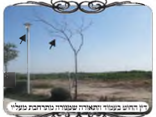
דין החוט בעמוד ותאורה שמנורה מתרחבת מעליו

באותו ישוב היה מקום של טיילת קצרה צמודה לישוב, לאורך נחל שעובר שם, וכיון שרבים הולכים לשם בשבתות, ועשו שם עירוב עם צורות הפתח על ידי קשירת חוטי ברזל לעמודי תאורה וכמובן היו בהם הרבה בעיות, החוטים היו רופפים ושוקעים, חוטי הברזל הם גם מזוגזגים, ובנוסף הקו עבר מעל עצים שנשתלו לאורך הטיילת, ולכן ברור שהענפים מזיזים את החוטים לפנים ולחוץ בצורה שפוסלת לגמרי, אלא שהאחראי אינו מדוע לחומרת הבעיה.