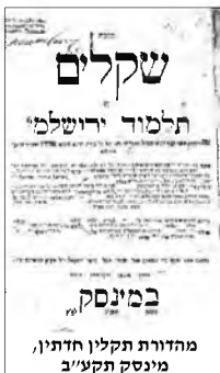
מהדורת תקלין חדתין, מינסק תקע"ב

אלא כך נראה לי כי כל דברי הר"ת ורגמ"ה והרמב"ן על הגהות תלמוד בבלי דיוקא אשר מיום שנחתם ש"ס בבלי שמשו בו רבנן שבוראי וגאוני קמאי ובתראי סלסלוהו