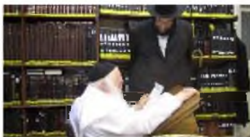
כעבדא קמיה מריה

רבינו שליט"א חיבבו וקירבו בימין צדקו, ובכל פעם שהיה מגיע למעונו היה מקדיש לו זמן רב יותר מהרגיל. בשנים האחרונות היתה לו קביעות מיוחדת להשתתף בלימוד המיוחד של מרן שליט"א עם גיסו הגר"י זילברשטיין, ומלבד זה היה זוכה לשבת לצד מרן שליט"א כמה פעמים בשעות הערב במשך השבוע, וכבר הזכרנו את הדברים אחרי הסתלקותו ז"ל.