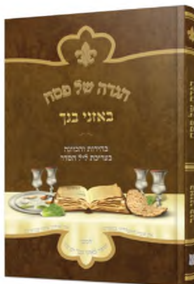
מבית "באוני בנך" להערות והארות, ולהשגת העלון, ניתן לפנות במייל: z6161523@gmail.com

אבל משימה זו נראית לכאורה כבלתי אפשרית. איך אפשר להביא את עצמנו להרגשה ממשית שהצרות שהיו לישראל הם ממש הצרות שלנו והחירות היא כמו הישועה שלנו, והלא בפועל לא היינו שם ולא חווינו את המהלכים. והקושי בזה הוא שבעתיים מאחר שאנחנו שוב בגלות ואכתי עבדי אחשוורוש אנן, וא"כ כיצד נצליח לחוש עכשיו שיצאנו מעבדות לחירות.