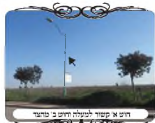
חוט א קשור לבעלה חוט ב כדור

אבל הבעיה בזה שהחוט שמעל ראש עמודי תאורה נמצאים בגובה רב מאוד, וכשמתקנים את העירוב משתמשים במנוף או טרקטור לעולת לגובה אבל כאשר אח"כ נקרע החוט, קשה לאחראי להגיע לגובה ראש העמוד, ואפילו בעזרת המוט הטלסקופי המשמש את העוסקים בעירוב, קשה להגיע לגובה זה. ולכן במקומות כאלו צריך לצייד את האחראי באמצעים מיוחדים להתמודד עם תיקונים בהתאם לתנאי השטח שיש לו.