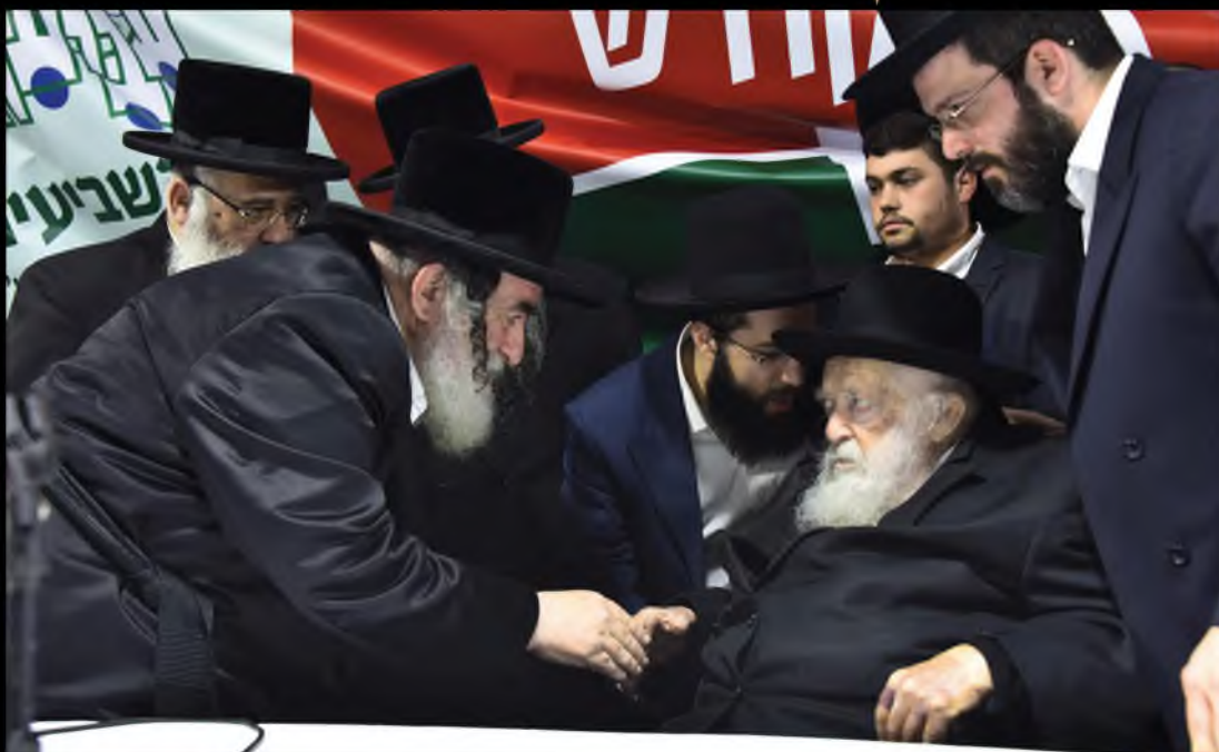
בכינוס שע"י קרן השביעית