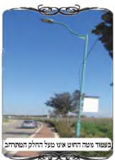
בעמוד טטה החוט אינו מעל החלק המתרחב

כשעברנו לאורך קו העירוב, גילינו שיש הרבה חוטים שאינם קשורים בראשי העמודים שהותקנו לכך, אלא קשורים בצידי העמודים, על הטבעת של הדגלים שרגילים להם, בהם, ולפעמים ראש אחד של החוט מעל גבי העמוד, וראש שני מן הצד. והסיבה היא כנראה כמו שבארנו, שבתחילה קשרו את החוט למעלה בעזרת מנוף, ואחר כך כשהחוט נקרע והיה קשה לאחראי להגיע, למעלה, הוא קשר מן הצד. איננו יודעים מה האחראי חשב, אם הוא לא ידע שאי אפשר לקשור מהצד, או שהוא ידע רק שבמקרה הזה משהו אמר לו שכשיש התרחבות זה נחשב מעליו כמו לחי. אבל היתה כאן בעיה שפוסלת מעיקר הדין, כי לפי מה שהתבאר לנו מחשיבים את החלק הרחב כמו לחי נפרד, ואז לא מתחשבים כלל בעמוד כי כלפיו החוט קשור מהצד, וא"כ צריך שהחוט יהיה מכוון בדיוק כנגד החלק המתרחב שבתחתית העמוד, כמ"ש