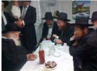
רבינו שותה 'לחיים' בחול המועד סוכות, בסוכתו של הגרי"ש ז"ל כששהה בסוכות בבני ברק