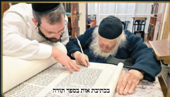
בכתיבת אות בספר תורה