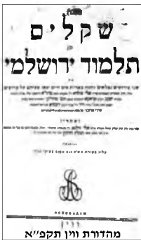
מהדורת ויין תקפ"א

היוצא מדבריו, שהירושלמי מעיקרו מוחזק כספר שאינו מוגה, בניגוד לבבלי, ולכן אף הראשונים הגיהו ותיקנו בו הרבה. ועל כן לא שייך בו כלל עניין האיסור להגיה בספרים. ואדרבא, הדפסת הירושלמי בנוסחתו המתוקנת היא השבת עטרה ליושנה.