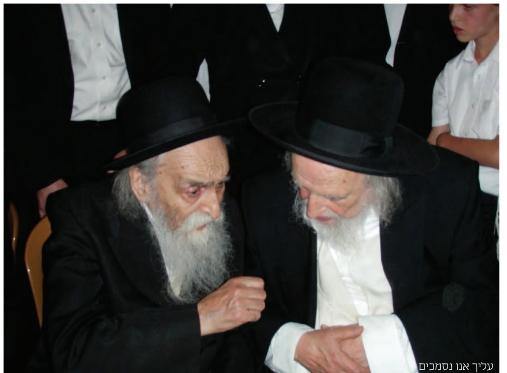
עליך אנו נסמכים