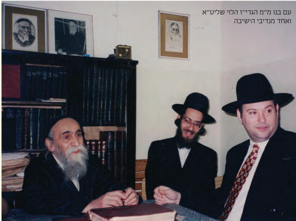
עם בנו מ"מ הגר"י הלוי שליט"א ואחד מנדיבי הישיבה

בעת שלמדו בישיבה – סיפר הגאון רבי יעקב שוב - הייתה תקופה בת כמה חודשים שאשת חבר הרבנית תבלחט"א שהתה בבית החולים, ובכל זאת לא נתבטל השיעור היומי, דבר יום ביומו, ובתו הגדולה היתה ילדה קטנה ועמדה על ידו כל שעת השיעורים, בתפסה בשולי בגדיו... וכך נמסר השיעור בעוז ובגבורה. עוד תיאר, כי דרכו הייתה שלא היה סוגר את הגמרא בסיום השיעור, בגדר 'לא יהא חלקי ממעמידי בית המדרש', אלא היה פוסק מדיבורו ומשתתק, וכך ידעו שנסתים השיעור. במשך השנים היה מוסר שיעור מידי חודש לחבורת אברכים מבוגרי הישיבה, ובסיומו היה מדבר כדרכו דברי מוסר ויראה, הייתה תקופה שעברה עליו צרה גדולה שנתייטר בעקבותיה רבות, ובאותם הימים דיבר הרבה בענינה של תפילה מעומקא דליבא וחובתה, וחזו וחשו כי מעצמו הוא מדבר, מעוצם עבודתו הגדולה בתקופה זו כאשר שופך ליבו בתפילה בעת צרה.