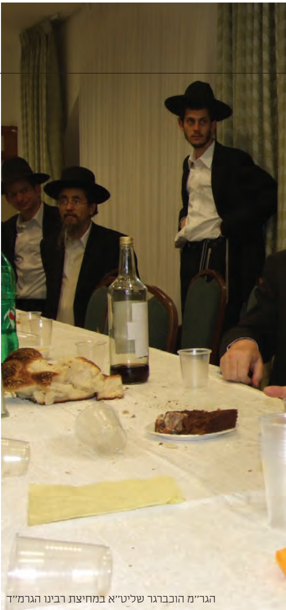
הגר"מ הוכברגר שליט"א במחיצת רבינו הגרמ"ד

יהיה עם בשר ודגים וכל מטעמים? מה יהיה עם לחם משנה?", מתברר כי לפני כן הורו לו הרופאים לא להכניס פירור לפה, והוא נשבר מכך ומאן להירגע. לא עניין אותו שום דבר. ישב ואמר תהילים וכל כמה דקות נאנח ונאנק, מה יהיה עם קידוש וכו'.