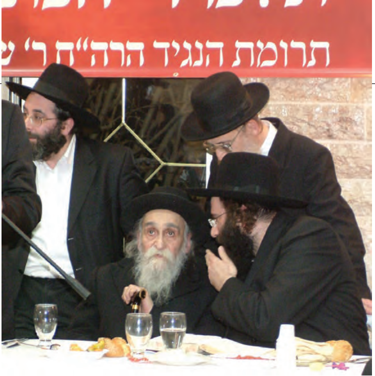
בביקורו במעלה אדומים