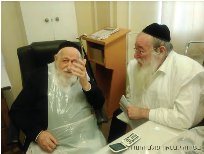
בשיחה לבטאון עולם התורה

מען האט שטארק גליטען פון דעם מצב - כמה צער היה לו מן המצב, צער נורא ואיום, זה עלה לו בנפשו ממש, היו מביאים לו עיתונים שיקרא וידע ממה שמתחולל בפרצות הדור, הוא היה חותך את הניירות, די צייטונג', כל שטיק'ל של הפרצות הגדולות היה גוזר ושומר