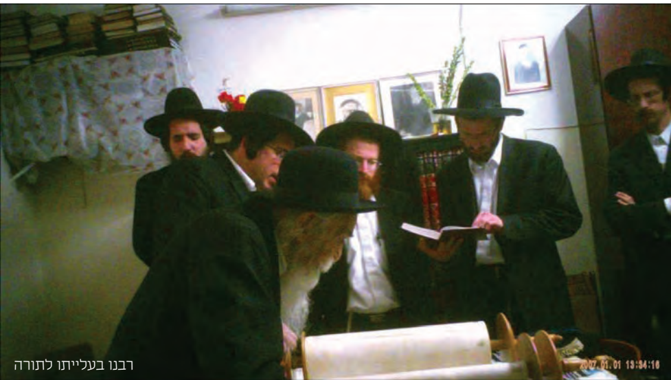
רבנו בעלייתו לתורה

בסידור קידושין נהג רבנו להורות לפני שהתחיל בברכת אירוסין, כי החתן והכלה יכונו לצאת בברכת בורא פרי הגפן, שי"א