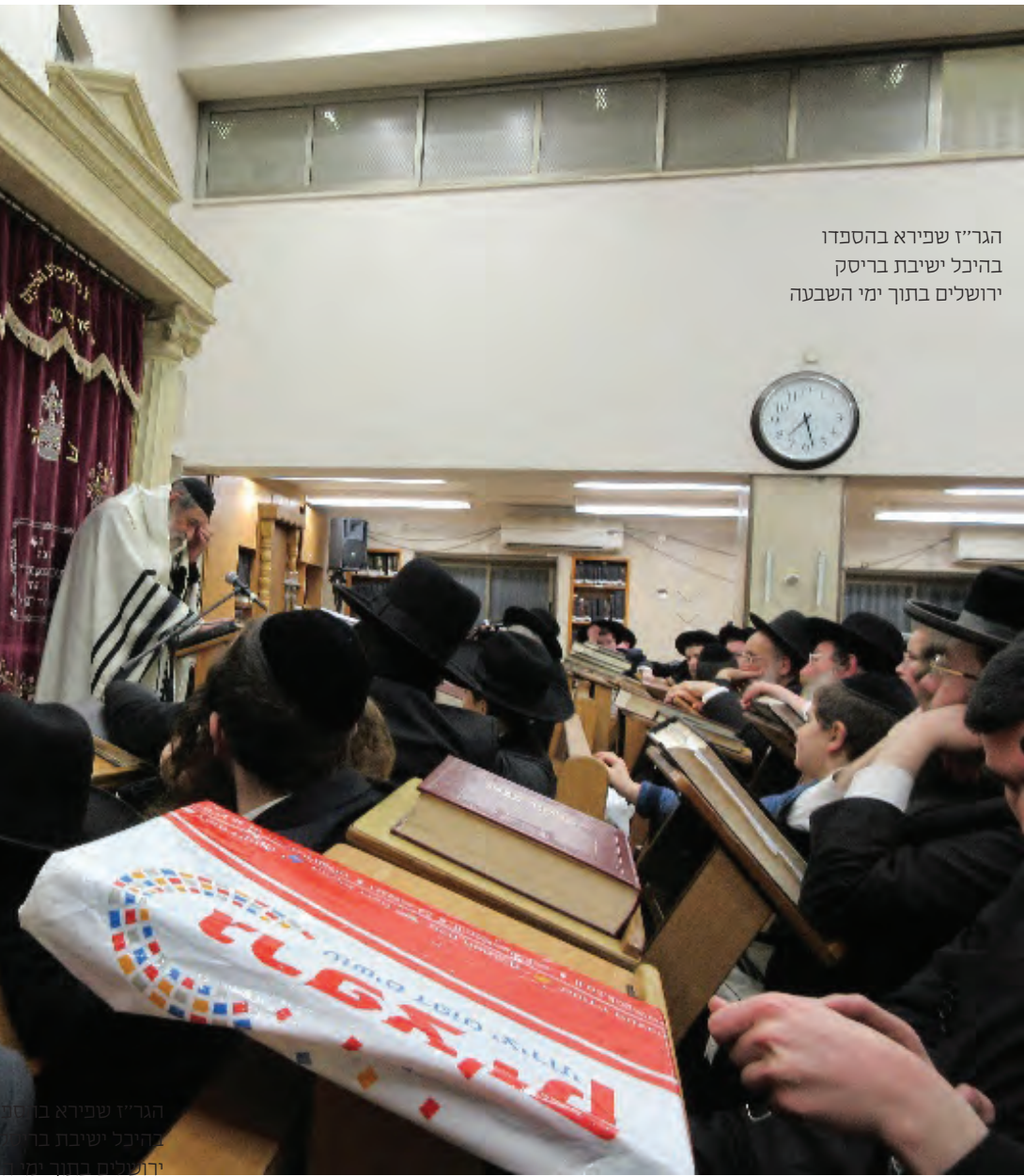
הגר"ז שפירא בהספדו בהיכל ישיבת בריסק ירושלים בתוך ימי השבעה