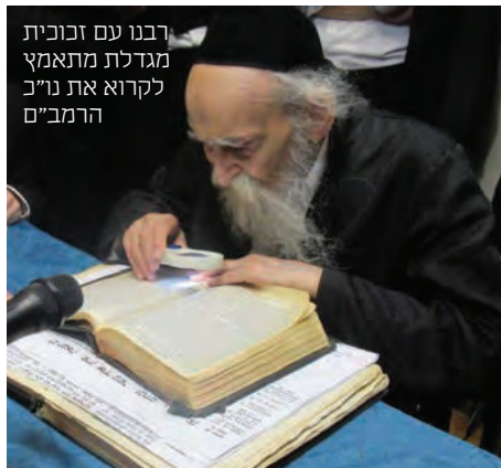
רבנו עם זכוכית מגדלת מתאמץ לקרוא את נ"ב הרמב"ם

קשה לתאר ולהקיף תוקף כאבו וכמה דמעות שפך, נוכח פירצת הנח"ל החרדי וגזירת חוק הגיוס, וכל חורבן הריסת ועקירת התורה והתדרדרות הדור פלאים, וטיכס עצות ועשה פעולות בגלוי ובסתר להציל את כלל ישראל, ובעיני ראיתי אותו מתחנן בפני רבנו בעל 'דרכי