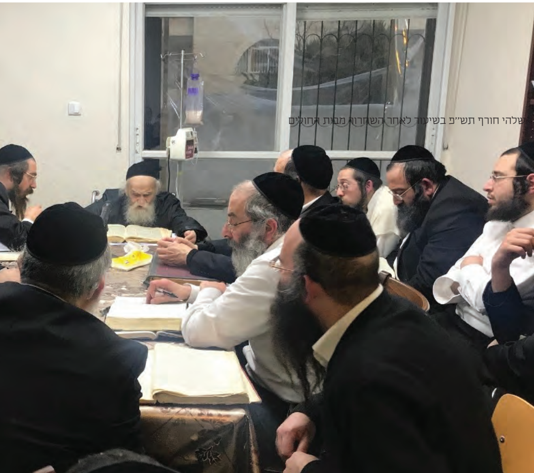
שלהי חורף תש"פ בשיעור לאחר השחרור מבית החולים

לו, יש מהציבור ששמחים בהרבה, ויש שטוב להם כצורת האמירה. משכך ביקש שאגש מיד להמשיך במלאכה, ולא אסתפק בזה שאני נותן את המחברות.