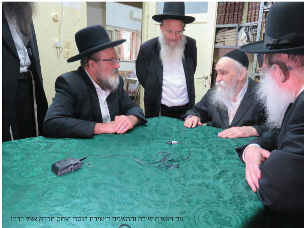
עם ראש הישיבה והמשגיח דישיבת כנסת יצחק חדרה אצל רבינו

"מעמד הר סיני בקודש פנימה, בליל שב"ק ויקהל אחר תפילת מעריב, בחדר הלימוד שספוג תורה ויראת שמים ומידות טובות, שוחחנו עם ראש הישיבה הגאון הגדול (שליט"א), ודן איתנו על גזירת הגיוס, שהגיעו להיכן שהגיעו רק בגלל השתיקה וההשתתפות בועדת שקד, וכבר אינו רגוע תקופה ארוכה