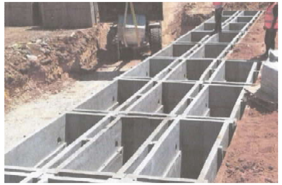
תמונה 8: מכפלות מבטון ע"ג האדמה

חומר חיטוי (ליזול) להעביר את הריח, ומעולם לא נשמע שיש ח"ו סכנה בדבר אם מוציאים אותם מן הארון לקוברם בקרקע, ואדרבה אם יקברו אותם עם הארון, יש בזה משום פגיעה בכבוד המתים, שבודאי רצונם להטמן באדמת ישראל. ועוד שהוא נגד המנהג המקובל בישראל. ולכן יש לעמוד על המשמר שלא לשנות דבר מן המנהג הקודם, ולא לפרוץ במנהגי ישראל הקדמונים. ע"כ. וע"ע בשו"ת הגאון מהר"א גוטמאכר (מיו"ד סי' קכ) בד"ה בכל. ע"ש. עכ"ל. והובא בילקוט יוסף (אגלות).