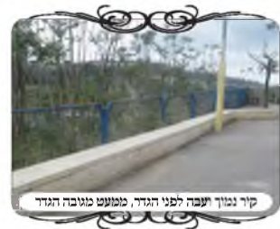
קיר נמוך עומד לפני הגדר, ממועט מגובה הגדר

דבר נוסף מתוך הדברים שהיו באותו עירוב, בגינה שיש לה גדר ברזל בגובה מטר, והגדר משמשת את העירוב. בתוך כדי הבדיקה עברנו יחד עם האחראי במהירות לאורך הגדר, כי לא היתה נראית שום בעיה, גדר יציבה וחזקה. אבל לפתע הבודק שם לב לשאלה הלכתית בכשרותה. בקטע מסוים באורך כעשרה מטרים, העיריה בנתה לפני הגדר קיר אבן רחב בגובה כחצי מטר, ורוחב ארבעים ס"מ, על מנת שישמש ספסל לשהיה בגינה. ובין הקיר לגדר היה רווח של כעשרה ס"מ בלבד. יוצא אם כן שהעמוד בגינה אין לו מחיצה י