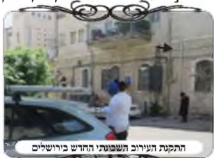
התקנת העירוב השכונתי החדש בירושלים

הלכתה, מ"מ דינו כמחיצה ממש שיוצרת רשות היחיד סביב העמוד, וא"כ העמוד נמצא בתוך רשות אחרת]. אבל במקרה כזה י"ל שלא שייך דין זה, כי אין אומרים דין פי תקרה יורד וסותם במקום שפתחו מג' צדדים, אלא רק כאשר יש לפחות שתי מחיצות כצורת גאם [כמו אות ר'], כמו שפסק הרמ"א (סו"ס שס"א). וכיון שתחת המרפסת פתוח מג' צדדים, אין תחתיה דין פי תקרה, וא"כ העמוד אינו מוקף במחיצות, והוא כשר. אמנם יש חוששים שמא מן התורה אומרים פי תקרה גם מג' רוחות, וא"כ לחומרא אולי זה מסלק את צורת הפתח. אבל הוראת רוב רבני העירובים שאין לחשוש לכך, ורק במקומות שיש שתי מחיצות גמורות ופי תקרה יורד בשני צדדים, צריך שהעמוד לא יהיה תחת המקום ההוא. ולמעשה כיון שהיה אפשר בקלות להימנע אפילו מחשש זה, הזנו את מקום העמוד אחרי התקרה, ויחד עם זה הקפדנו שהעמוד לא ייצא לרחוב הסמוך (רחוב שבטי ישראל), כדי שלא יכנס לחשש רשות הרבים כנ"ל.