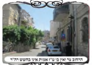
הרחוב עידו ואין בו ט"ז אמות אינו בחשש רה"ר

מאות אברכים ת"ח כבר יודעים, עכשיו גם אתה יכול! 055-678-3323