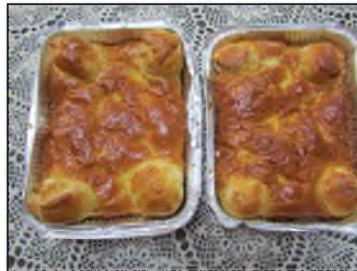
(גודל החלות בתמונה 15x20 ס"מ להמחשה בלבד)

לקיום מנהגים אלו ניתן להכין 2 חלות בתבנית מלבן חד פעמית ולהוסיף 4 חתיכות בצק בפינות. ראה תמונה: