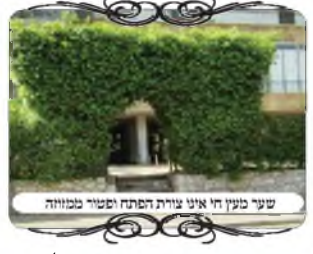
שני מעין חי אינו צורת הפתח וישור מזוזה

בתשובה לשאלה זו, יש להתייחס גם אל הקושי שבדבר מצד הסכמת השכן, וגם לשקול אם זה לא יעורר פגיעה אחרת בחוט העירוב בזדון, עד שיכול לצאת שכרו בהפסדו, לכן יש לדון מה מוכרחים מעיקר הדין, ומה רק בגדר חומרה. ובכן יש לדון בדבר זה מצד שני דינים, א. עמוד המוקף במחיצה, כי הצמחים שממלאים גובה י' טפחים הם מחיצה. ב. חשש פתחי שימא בשינוי צורת העמוד. והנה מצד שהעמוד לא יהא מוקף במחיצה (ע"י משנ"ב סי' שס"ג ס"ק ק"ג), מספיק לפסול את הצמחים ממחיצה, והיינו ע"י שישיר את הצמחים הגדלים הג' טפחים הסמוכים לקרקע, שאז הצמחים הם מחיצה תלויה ואינם פוסלים. ובמקרה זה לא קשה לפנות למטה ועיקר הבעיה היא בחלק העליון.