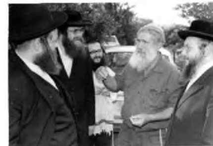
הגר"י מנדלזון שליט"א עם חקלאי שומר שמיטה