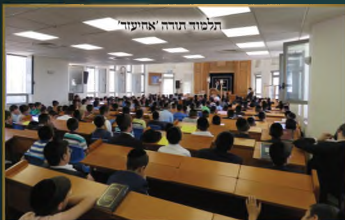
תלמוד תורה 'אהייעזר'