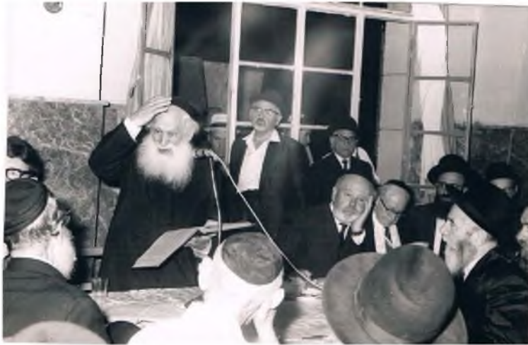
הגר"ש כהנמן ז"ע הרב מפוניבז'