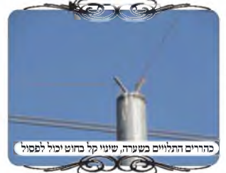
בחדרים התלולים כשהיה, שינוי קל בחוט יכול לפסול

כל ישוב ממוצע, ההיקף של חוטי העירוב המקיפים אותו הוא ארבע קילומטרים ואף יותר, כי ההיקף צריך לסובב סביב הרחובות ולהבדיל בין הבתים לשדות. לכן רוב הבדיקה נעשית בנסיעה ברכב, ובמקומות שיש שאלה יוצאים ברגל. בתוך כדי נסיעה שמנו לב באחד מראשי העמודים שהחוט נמצא בקצה ממש, ובקלות יכול להשתנות מעט ולהיפסל. אמרנו