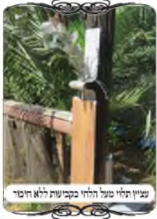
עניין תלוי סגור הולך בכביש ללא חיוב

אחד מהמקומות שהגענו בשבוע האחרון היה ביישוב באזור מודיעין, ושם יש מתחם להשכרה שפונה אל ההרים, והרבה קבוצות עורכות את הסעודות בחצר, באופן שלא שייך להימנע מלטלטל, ואע"פ שבאותו ישוב היה עירוב ממוקד ע"י אברך טוב, אבל רמת הכשרות לא הגיעה לרמה של שכונה חרדית רגילה. ולכן המשפחה פנתה אל מוקד העירוב כשבועיים קודם, בזמן שעמדה לשכור את המקום, ושאלה אם המוקד יוכל לסדר שם עירוב טוב, ולאחר האישור הם סגרו עם המקום. ואכן ביום חמישי הגענו למקום עם ציוד והקמנו את העירוב בצורה שיקף את האזור הפתוח שבו עורכים את הסעודות, כדי שיוכלו לטלטל בכשרות המהודרת.