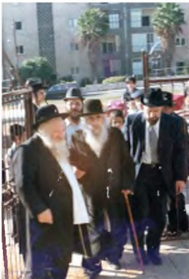
תמונה נדירה של מרן שליט"א עם להבחל"ח מרן בעל הקהילות יעקב ז"ע