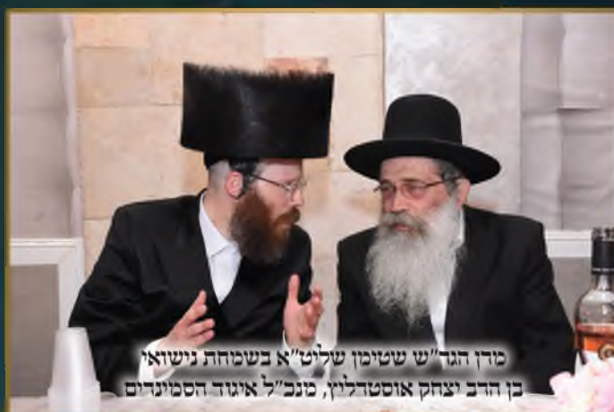
מרן הגר"ש שטימן שליט"א בשמחת נישואי בן הרב יצחק אוסטרלוץ, מנכ"ל איגוד הסמינרים