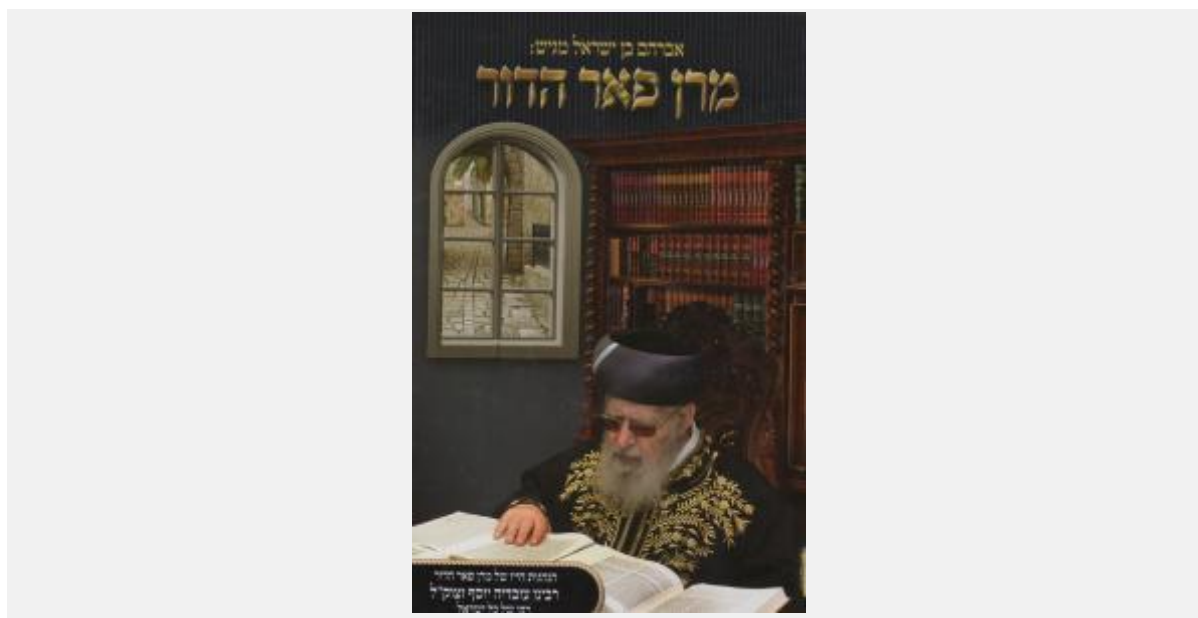
כריכת הספר "מגן פאר הדור" מאת הרב אליהו חי אביטן. בני ברק תשע"ד

בשלב השני על הממין והמקטלג לרשום את נושאי הספר ובהתאם להם לקבוע את מספר המיון של הספר. [40] רישום נושאי הספר וקביעת מספר המיון שלו מבוססים על אפיונו של הספר ועל שיוכו לסוגה ספרותית זו או אחרת.