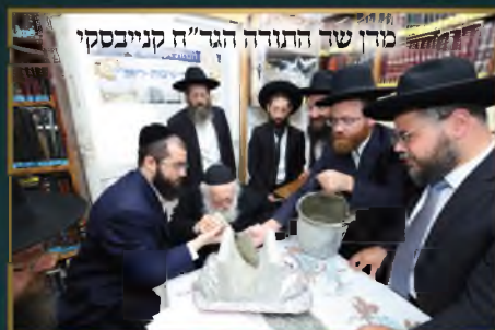
מדין שר התורה הגד"ח קנייבסקי