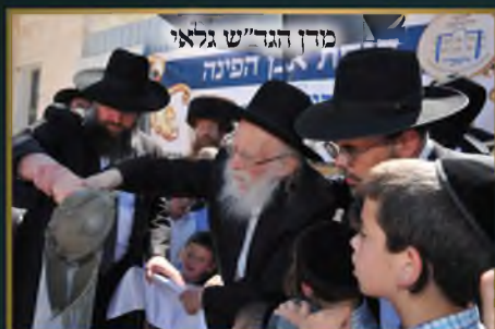
מדין הגד"ש גלאי