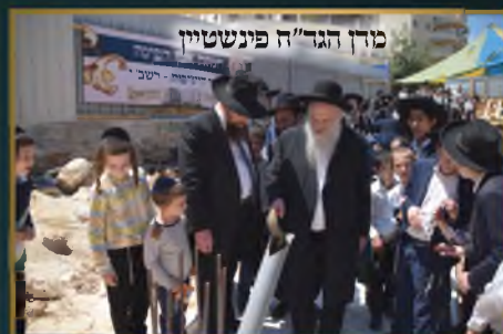
מדין הגד"ח פינשטיין