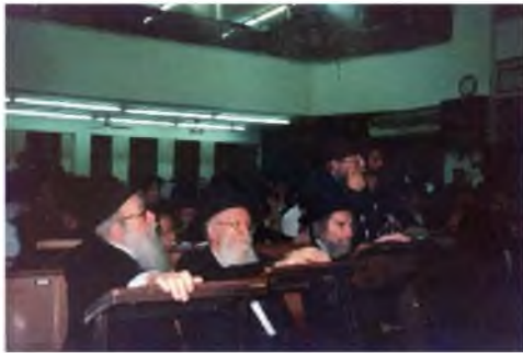
תמונה נדירה בפרסום ראשון: גדולי ישראל בשמיטה תשס"א משתתפים בכינוס לטובת השביעית בביהכ"נ לדרמן

לקראת שנת השמיטה התרח"צ כתב החזון"א מכתב לבעלי יכולת שסייעו בכסף לחקלאים לשמור שמיטה, וכלשונו "לגול החרפה מעלינו על ידי היתרי השעה שבכל שמיטה ושמיטה באין קץ, החולצים את זיקי האמונה מלב המפקפקים, וחושבים את מצות התורה כדברים נמנעים"..." (קובץ אגרות ח"ג אגרת פ"ג) בהמשך הוא מסביר כי בקיום מצות השמיטה כדין, תלויה בזה דחיפה עצומה לקיום התורה כולה ע"ש.