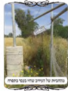
מרחבות של העירוב שהיו בעבר בתפרח

בשנתיים האחרונות השקיע האחראי שם הרבה מאוד בשידור העירוב, בהקמת גדרות ממש, בשיתוף