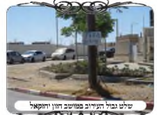
שילט גבול העירוב במושב חזון יחזקאל

אם כך, אנו רוצים לדעת, איפה הגבולות של העירוב, מי האחראי בשכונה שלי, המידע הזה לא נגיש, יש מעט שידועים, וגם הם אומרים רק בערך, וזוכרים את השם של האחראי הותיק שכבר מזמן אינו בתפקיד. והאברך החדש שבא לגור, נאלץ