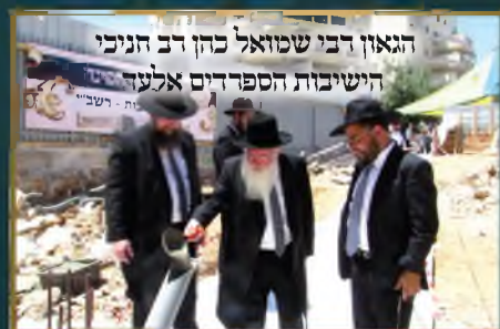
הגאון רבי שמואל כהן רב חניכי הישיבות הספרדים אלעד