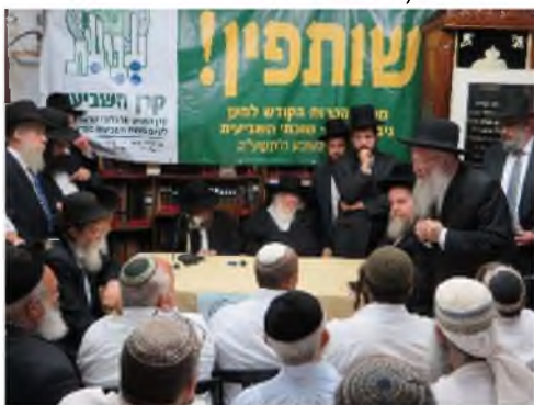
כינוס בראשות גדולי הדור לטובת החקלאים שומרי השביעית. שמיטה תשע"ה.