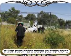
בדיקת העירוב בין הקוצים בתפרח בשנת תשע"ה