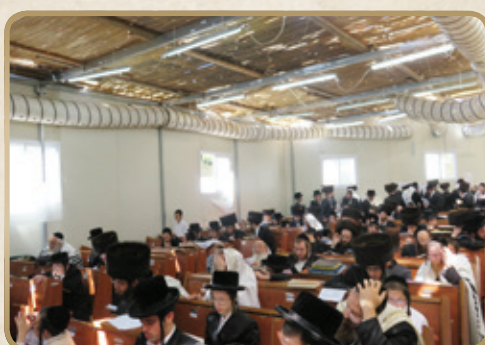
שיעור בעמוד החבורה בחוה"מ בביהמ"ד בירושלים

נראה אפוא, שגם הברייתא שהובאה בסוגיה שלנו, ברכות יח ע"א, מדברת הובלת עצמות שנלקטו לשם קבורה שנייה בקברי אבות או בירושלים. וזהו שהקפידה הברייתא לדבר על "המוליך עצמות ממקום למקום", שכן אין מדובר כאן בגופת נפטר שלימה אלא רק בעצמותיו ולאחר שנתעכל הבשר, שאותן כאמור, אין חשש להוביל למקום רחוק. כעת גם מובנת אזהרת הברייתא: " לא יתנם בדסקיא ויתנם על גבי חמור וירכב עליהם, מפני שנוהג בהם מנהג בזיון", שכן לכאורה תמוה, הרי "דסקיא", הוא "מרצוף גדול של עור" (פירוש רש"י על אתר), אך לא כה גדול שביכולתו להחזיק גופת אדם שמידותיו הרגילות הן יותר משלוש אמות גובה ואמה רוחב, אם כן מה טעם הוסיפה הברייתא אזהרה זו? ניתן אכן לדחוק ולומר, כי מדובר בנפטר נמוך קומה, אך אחרי שידענו שמדובר כאן בהובלת עצמות הנפטר לאחר עיכול הבשר, בלא לשמור על שלמות השלד (שהדבר כמעט לא היה אפשרי), מובן היטב כיצד אפשרי הדבר לתת את עצמות הנפטר בשק עור קטן יחסי כ'דסקיא'.