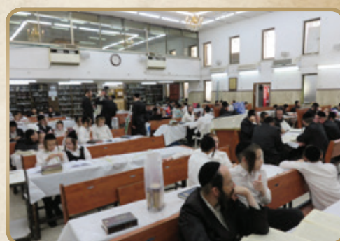
סדר הלימוד בחוה"מ בשיטבל בב"ב