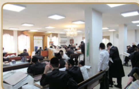
סדר הלימוד בחוה"מ בשיטבל באלעד