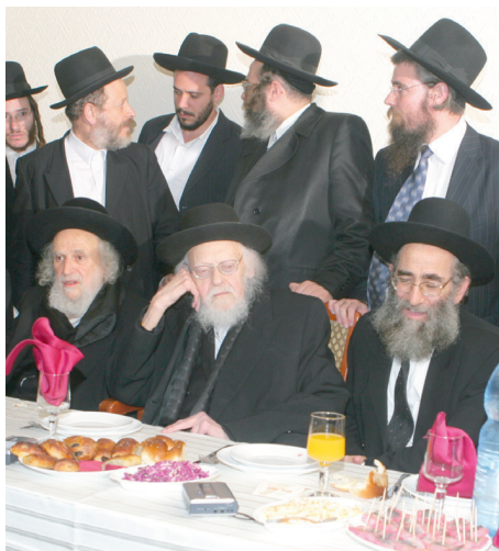
איזהו התואר הנאה לו?"

מרן הגרש"ז אויערבאך ענה לו ככהאי לישנא: "את שאלותיך תפנה לרבי יוסף שלום אלישיב, אותו אפשר לה-עיר באמצע השינה ולשאול את השאלה המסובכת ביותר. הוא יענה מיד, מבלי לחשוב אפילו, כי הכל מסודר במוחו. בזמן לימודו הוא כבר לוקח בחשבון את כל ההיכי תמציי וסוגי השאלות העשויות להתעורר, ומשנתו סדורה לו בכל עניין ועניין". הגאון רבי עזריאל אויערבאך שליט"א מגולל בפניו את אשר שמע פעמים רבות מפי אביו, שהיה אומר אודותיו תדיר: "אין הוראה אצו רע, דער גרעסטער!" ("בענייני הוראה, הוא הגדול