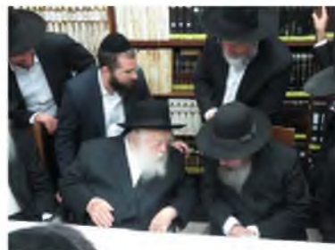
רבינו שליט"א עם הגר"ד שליט"א

ארבעה ימים אחר, הריץ לו הגר"ד שליט"א מכתב תגובה, והוא מגיב לו על הדברים "ומה ירב הצער, על אשר תמורת שתבוא על בטויה הראוי והשלם, הכרת תודתי על הנכונות וטוב החסד, אשר יגלה הדרתו לברור ספקותי מידי פעם בפעם, נתעורר פקפוק חשש בלב הדרכ"ג שליט"א, כאילו קיים ההיפך מכך, ואבקשה מאוד מהדרתו שימחלו לי על שבגיני נגרם צער להדרתו".