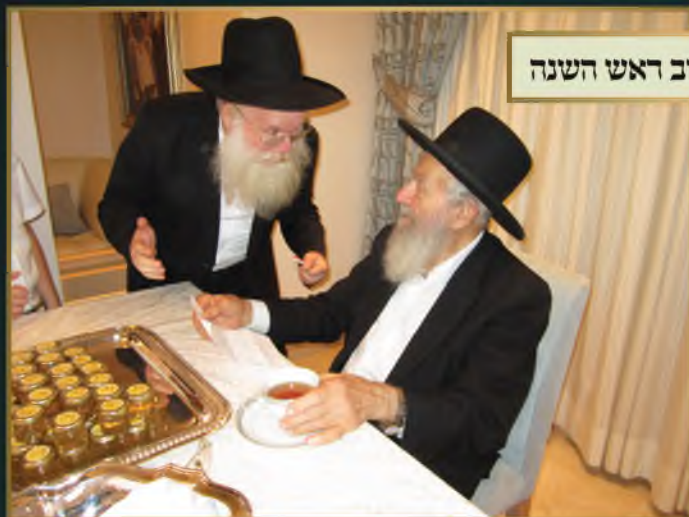
חלוקת דבש בערב ראש השנה