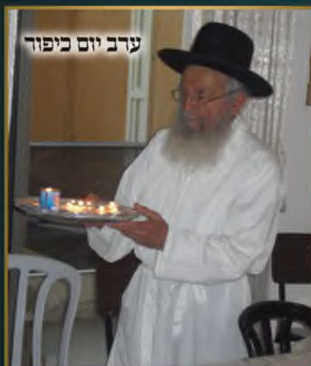
ערב יום כיפור