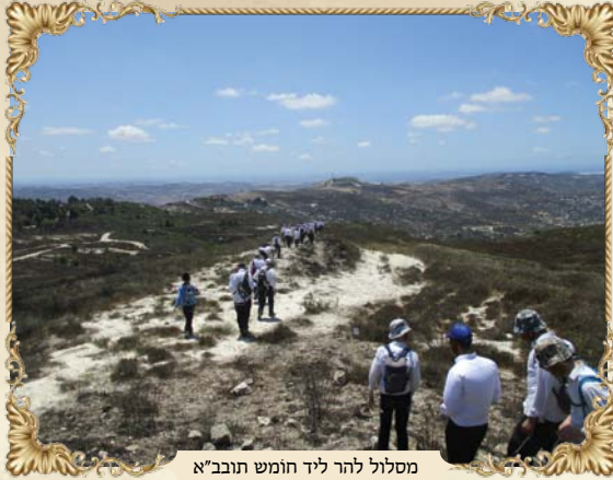
מסלול להר ליד חומש תובב"א