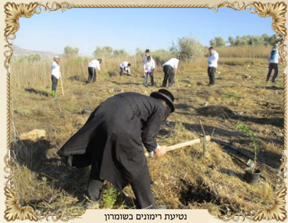
נטיעת רימונים בשומרון

משם נסענו להשתכשך במעיינות עין נקורה, על הדרך ההולכת הרה עיבל, כהבטחת התורה -