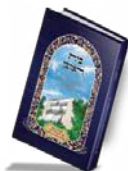
בית ראובן מדריך מקיף לקניית בית מתוך רוגע שמחה והודיה

להשיג בפלאפון: 055.6785647 - משלוחים עד הבית