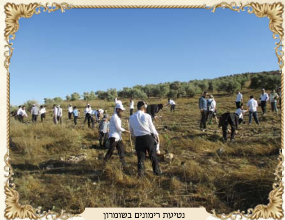
נטיעת רימונים בשומרון

מקבלים משמעות אחרת ומציאותית יותר כאשר רואים את השטח בו הם התרחשו.