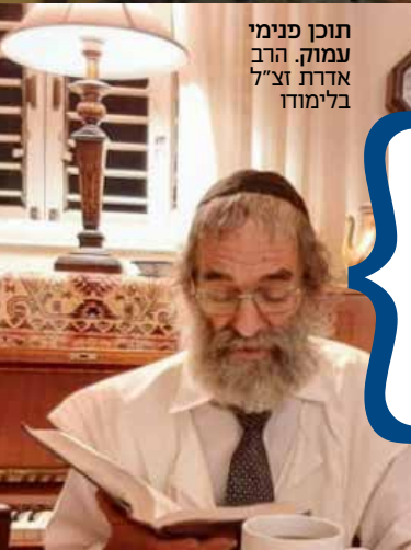
תוכן פנימי עמותת הרב אדרת זצ"ל בלימוד

”בחוץ שרר קור של ארבע מעלות, ועל אף שהתעטפתי במעיל צמר רעדתי מקור. אבל הרב ירד ליד המעיין וחזר תוך כמה דקות”