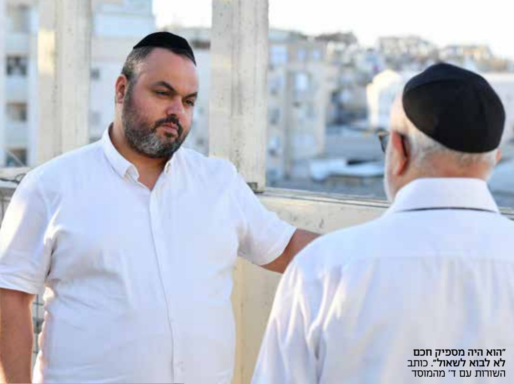
"הוא היה מספיק חכם לא לבוא לשאול". כותב השורות עם ד' מהמוסד

"קודם כל האותנטיות. הוא היה איש אמת ומעולם לא ניסה להיכנס לדמות שאינה הוא. הפשטות שלו הייתה אמיתית. מעבר לזה, הרי מדובר באדם שהיה בקי ב'שולחן ערוך' לפרטיו, מדקדק בהלכה קלה כחמורה, מתחסד עם קונו בדברים שרוחקים מהמושגים שלנו. בכל זאת הוא היה מתנהג בצניעות ובענווה. הוא היה אדם חביב שנותן מעצמו לזולת בלי גבול ועם