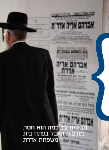
מבינים עד כמה הוא חסר מודעות אבל בפתח בית משפחת אדרת

"החיבוק הראשון שקיבלתי ממנו בפעם הראשונה שנפגשנו - ומאז היו עוד כמה עשרות חיבוקים - היה בדיוק כמו החיבוק האחרון שקיבלתי ממנו ביום חמישי שלפני התאונה"