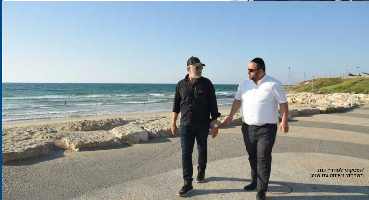
"הפסקתי לפחד". כתב 'משפחה' בשיחה עם שטג