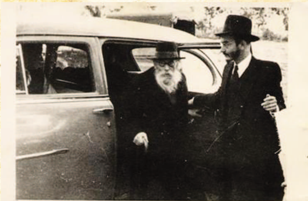
הדחים את עולם הרפואה. מרן החזון איש בתמונה שצולמה בשנת תש"י

בזמנו, לפני קרוב ל-50 שנה, כאשר שקד הרב סורסקי על כתיבת הספר על החזו"א, הוא פנה אל פרופ' אשכנזי וביקש לשוחח אתו לצורך כתיבת פרק מיוחד בספרו. אשכנזי קיבל אותו בביתו