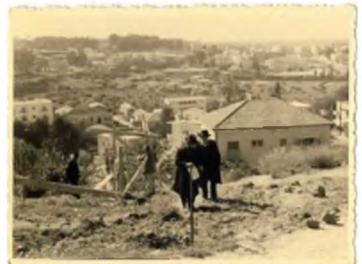
בני ברק השלמה והרצל. ברק, משה ישיבת 'סלבודקה', החולק ונבנה באותם ימים

מה היה באותם שנים קדמוניות, אליהם אנו כה מיחלים? רבינו שליט"א (למכסה עתיק מלאכי ג' ד') מביא כי בתורת כהנים (שמיני מכילתא דמילואים סימן ל"א) מובא כי הכוונה לתקופת שנות חייו של הבל, שאז לא היו עובדי עבודה זרה. ולזה אנו מקוים ולוואי ותערב לה' תפילתנו ותהיה זכה ומקובלת כמו בתקופה ההיא. אף אנו נענה ונאמר: ולוואי ונזכה להעביר את ניחוח הקדומים, מעולמות תמירים בהם, עולמות של שלווה וישוב הדעת, של יראת שמים טהורה, ללא טומאת העבודה זרה שנתנסינו בה בדור זה, טומאת הטכנולוגיה, הנוטלת מאיתנו את מעט השלוה שעוד נותרה.