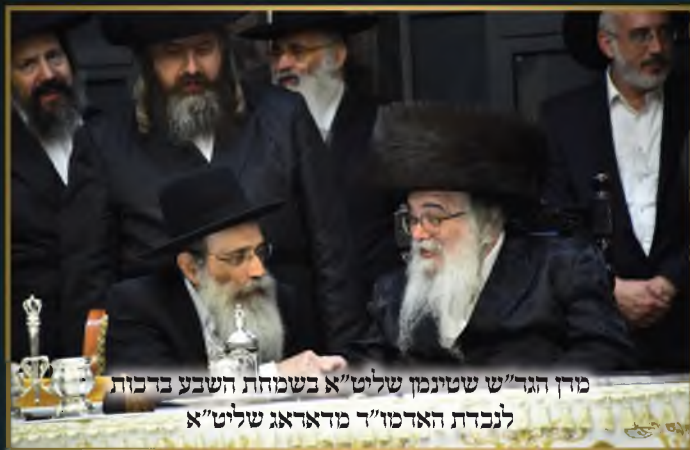
מרן הגר"ש שטינמן שליט"א בשמחת השבע ברכות לנכדת האדמו"ר מרדאג שליט"א