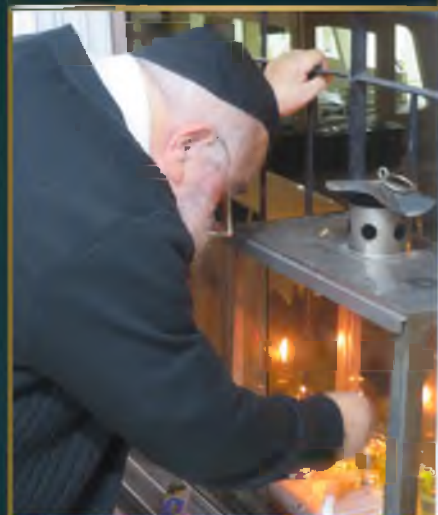
מזן הגר"ע טולדנז שליט"א