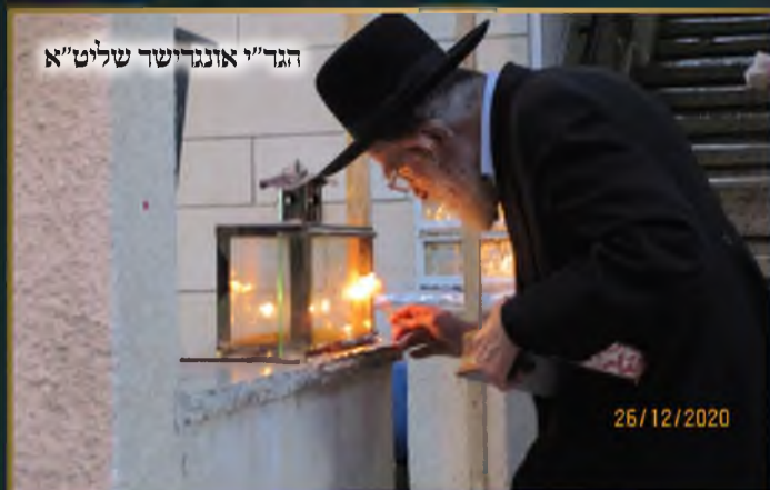
הגד"י אונגרישור שליט"א