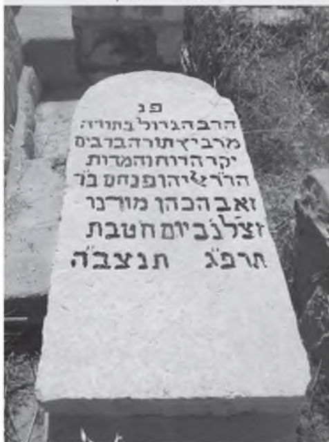
מצבה אחרי שיפוץ