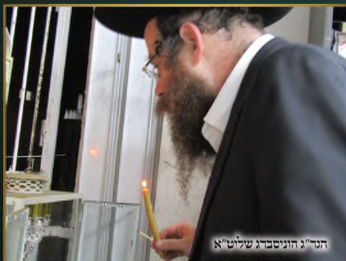
הגד"ג הוניסברג שליט"א