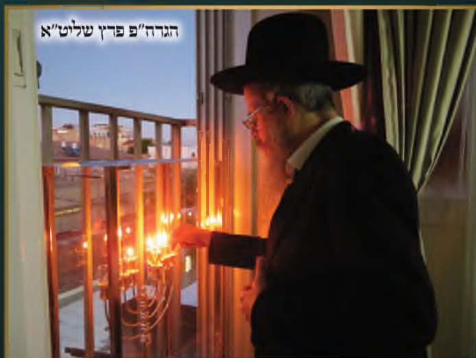
הגדח"פ פדץ שליט"א