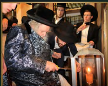
מזן הגר"מ שטרנבוך שליט"א