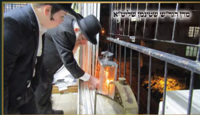
מרדכי הגד"ש שטינמן שליט"א