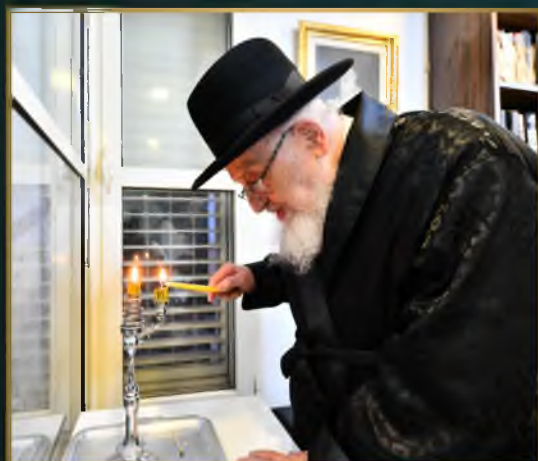
מזן הגרמ"צ בדגמן שליט"א