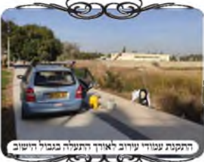
התקנת עמודי עירוב לאורך התעלה בנחל הישוב

המצב הזה מביא שמחה גדולה לעוסקים במלאכת הקודש, כאשר עוד ישוב נכנס למתכונת של עירוב כשר, למרות שאינו מהודר ברמת העירובים השכונתיים, יש בזה זכות גדולה של כמה מאות משפחות ובהם יותר מאלפיים תושבים, שמכאן ולהבא יימנע מהם חילול שבת גדול. ואם נעשה חשבון קצר, כל אחד נושא בממוצע כעשרה פעמים במשך השבת, מוציא או מכניס דבר מהרחוב, ובפרט אלו שהחצר שלהם אינה סגורה שגם הוצאה לחצר אסורה ללא עירוב, הרי זה יותר מעשרים אלף מעשים בשבת אחת, שע"י תיקון העירוב כדיו חובה לציין שגם כל התורמים