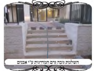
השלמת גובה גרם המדרגות ע"י אבנים

דבר דומה לכך, נפגשנו בחודש הקודם בשעה שבדקנו עירוב באחת השכונות בירושלים, שגם שם יש הרבה בנינים באמצע בניה, ולכן האחראי לא יכול לעשות פתרון קבוע, ונדחק למצוא פתרונות חדשים בכל פעם שמשנים את המדרכות והגדרות וגם שם היה מקום שהיה צריך להשתמש במדרגות שיהיו למחיצה, אלא ששם היתה בעיה אחרת, שהיו רק חמש מדרגות, והם לא הגיעו לגובה י' טפחים. וגם הוא בחר בפתרון דומה, והעמיד אבנים משתלבות בראש גרם המדרגות, שישלימו את גובה המחיצה, [ובמקרה זה לא עשה שורה של אבנים, אלא השאיר רווח פחות מג' טפחים ביניהם, שמדין לבד נחשבים כסמוכים ומשלימים את המחיצה].