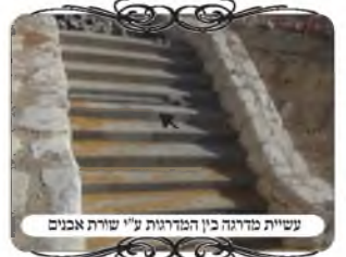
עשיית מדרגה בין המדרגות ע"י שורת אבנים

והנה במדרגות יש בדרך כלל שיעור של תל המתלקט, דהיינו כל מדרגות עולות לגובה י' טפחים בתוך פחות מד' אמות, אבל הבעיה היא שהן אינן עולות ברצף של שיפוע, אלא יש באמצע הפסקה של קרקע ישרה, כל מדרגה עולה טפח וחצי ומתיישרת שלשה טפחים. בדין זה הסתפק הביאור הלכה (סי' שס"ב) וצייד שבתל משופע אומרים שזה צורת ברייתו, אבל בחלקי מחיצות לא מצרפים כאשר השטח הישר הוא ד' טפחים, ואולי גם בתל טפחים. ובחזו"א פסק שבין בתל ובין במחיצה, לא מצרפים את החלקים הזקופים לשיעור מחיצה, כאשר יש שטח ישר [או כמעט ישר פחות משיפוע המתלקט] במשך ד' טפחים. לכן במדרגות שבזמנינו שברוב המדרגות רוחב המדרגה נמשך כ 30 ס"מ, שזה שיעור יותר מג' טפחים לכל הדעות, ופחות מד' טפחים לכל הדעות, ההוראה היא שמעיקר הדין הן כשרות למחיצה, ומ"מ בעירוב מסודר מקפידים לעשות צורת הפתח. ועפ"ז סמכו גם כאן שהם יהיו המחיצה באופן זמני.