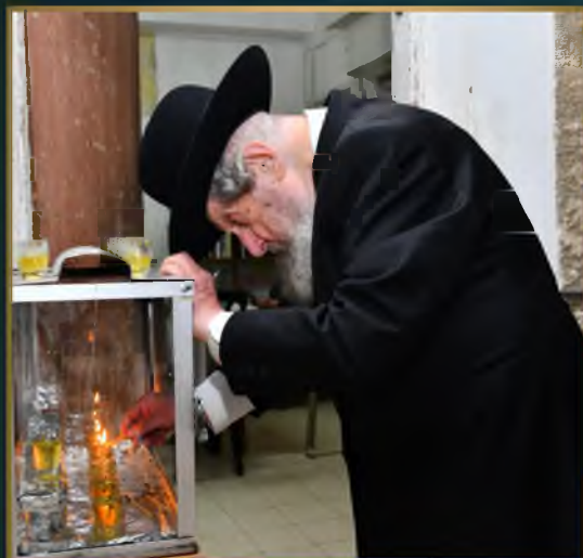
מזן גאון ישראל הגר"ד לנדז שליט"א