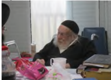
צהלתו על פניו.

בשנים האחרונות קבע רבי ישי את מקומו בבית הכנסת 'בית תפילה', בראשות בן רבינו, הגאון רבי אברהם ישעיהו שליט"א, ושם כיבדו אותו כיאות לצדיק כמותו.