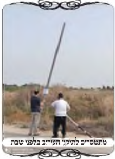
מתנסים לתיקון העירוב בלפני שבת

בישוב זה הגענו לפני כמה שנים, והראינו להם קטע מסוים בנחל שלא היה בשיפוע המתלקט, אך לא בדקנו את כל אורך התל, מחמת שיש עליו צמחיה עבותה וקשה לראות אותו. באותו זמן הם תיקנו את החלק שהוכח שאינו בשיעור המתלקט, ועשו לפני עמודי עירוב, אבל בשאר אורך התעלה נשארו לסמוך על השיפוע מדין תל המתלקט. בחודש אלול האחרון היתה שוב התעוררות בישוב לבדוק את מצב העירוב, ושוב הגענו והוכחנו על קטע אחר שהשתנה מחמת סחף הגשמים ונפילת האדמה, ואינו משופע כדיו, והם הסכימו שצריך לעשות עמודי עירוב לאורך שאר התעלה. הפעם הם ביקשו שנתקן את העירוב מיד לאותה שבת, כדי שלא יישארו בלי עירוב [כיון שבנוסף היו עוד בעיות בעמודים בכמה מקומות]. אבל באותו יום זה לא היה אפשרי לעשות מיד