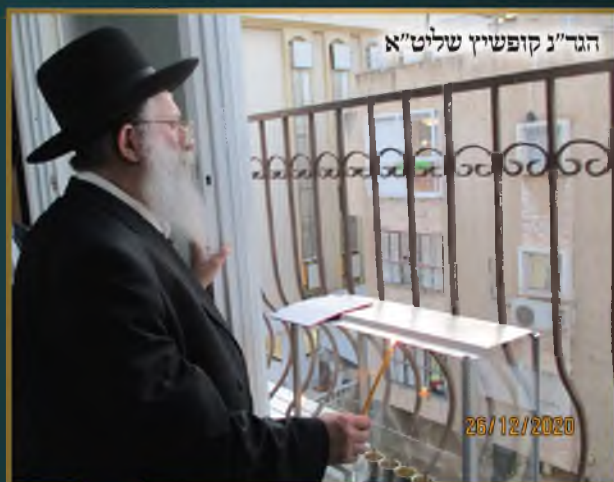
הגד"ג קופשיץ שליט"א