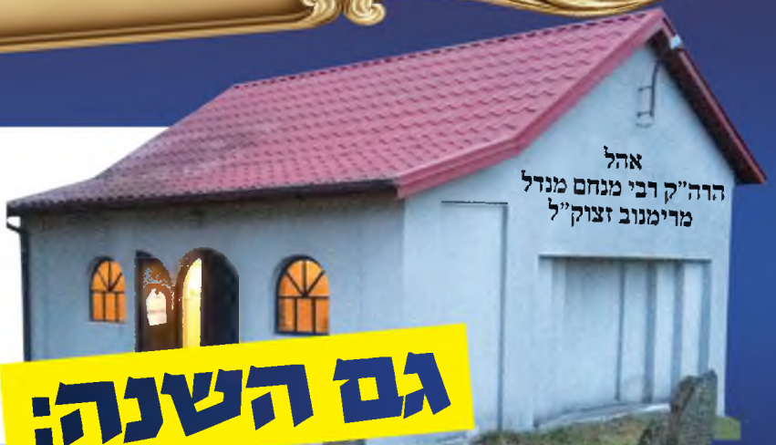
אהל הרה"ק רבי מנחם מנדל מורימנוב זצוק"ל

ובתפילה המיוחדת לפרנסה יזכירו כל שם במתינות ובכוונה שתקויים בהם ההבטחה הנוראה לפרנסה בשפע ובנקל