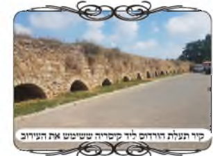
קיר תעלת הורדוס ליד קיסריה ששימש את העירוב