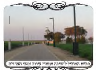
כביש המוביל לישיבה ונעדר עירוב משני הצדדים

בשבוע זה ניגשנו לבדוק עירוב שנעשה לאחת מהישיבות שנמצאות בקצה של אחד מהישובים בדרום הארץ, והקיפו את הרחוב המוביל לשיבה עם צורות הפתח משני הצדדים, כדי לחבר בין הישיבה לבין הבית הראשון בשוב ששייך לצוות הישיבה. הנהלת הישיבה השקיעה בעבר בתיקון העירוב הזה, וביקשה ממוקד העירוב להוסיף לחיים לעמודים, בפרט במקום שהעמוד התעקם מעט, על מנת שיהיה בכשרות המקובלת בעירובי השכונות החדיות בארץ הקודש.