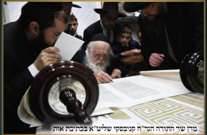
מזן שר התורה הגר"ה קניבסקי שליט"א בכתיבת אות