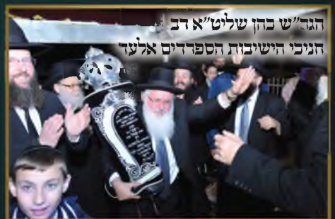
הגר"ש כהן שליט"א רב חניכי הישיבות הספרדים אלעד