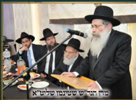
מזן הגר"ש שטינמן שליט"א