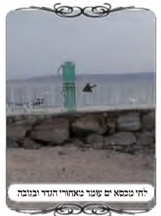
החוף מנסה ים עוטף מאחורי החדר ובמבט

השעה כבר היתה מאוחרת מאוד, והשואל הביט ומצא שיש כסאות על החוף שהם נפתחות לשכיבה ממש, ויוצא שהם יכולים לעמוד ישר, לקח שני כסאות וקשר אותם, עם חוט מעליהם, ועשה צורת הפתח. אמרנו לו שישמח שמחה גדולה, שמנע מכשול של עשרות אנשים, וזיכה אותם בשמירת