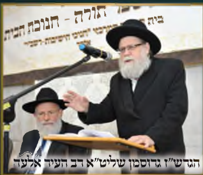
הגר"ש גרוסמן שליט"א רב העיר אלעד