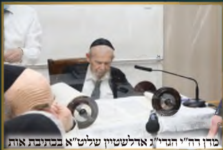
מזן דה"י הגר"ג אדלשטיין שליט"א בכתיבת אות