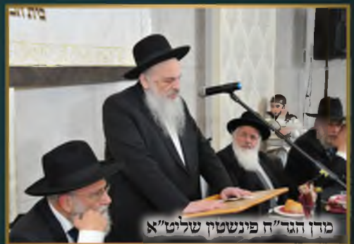
מזן הגר"ח פינשטיק שליט"א