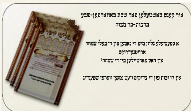
איר קענט באשטעלען פאר שבת באווארפען-שבט ברכות-בר מצוה

החותם בכל חותמי הברכות - עקיבא משה דייטש . בני ברק