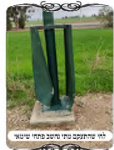
לחי שהתעקם ונחש פתחי שיטא

בשעה שבדקנו את תקינות העירוב, גילינו שני מקומות שהלחיים התעקמו מאוד, מחמת כלי רכב ואוטובוסים שנתקעו בהם, [והגענו עבור זה, בעקבות פניה של הנהלת הישיבה למוקד העירוב שיבואו לבדוק כי אירעה תקלה]. נשאלת השאלה האם יש בעיה הלכתית בלחי כזה, כאשר למרות העיקום כולו נמצא מתחת החוט, ומהו שיעור העקמיות שיהיה בו בעיה.