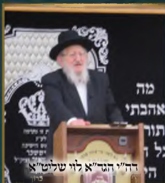
רה"י הגר"א לוי שליט"א