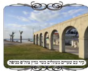
קיר עם שערים מעוגלים כשר מדן צוה"פ כיפה

מהחלקים הסגורים, ואין העמוד מרובה על הפרוץ בקטע זה. ואע"פ שבסה"כ בעירוב יש רוב סגור, אך העמודים שבין הפתחים מתבטלים מדן אתי אוריא דהאי גיסא ודהאי גיסא ומבטל ליה, וממילא נהיה פירצה יותר מי אמות והדבר היה לפלא, שלפעמים חומה גדולה וארוכה אינה מחיצה כשרה.