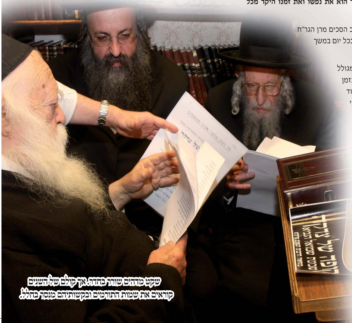
שקט מההם שיותר בפתח צדק קולם של השנים קוראים את שמות התורמים ובקשותיהם מנסר בתלל