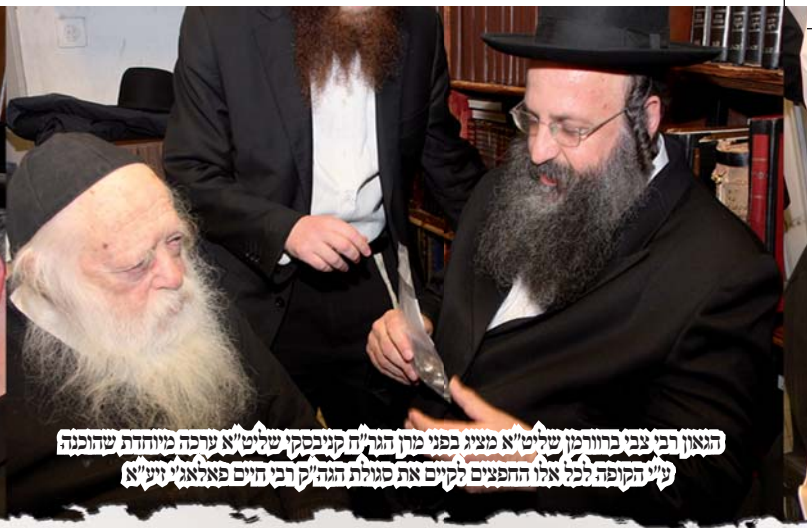
ומפתיע את הנוכחים כאשר הוא מורה כתשובה לאחת מן השאלות להוציא מן הארון גמרא כתובות