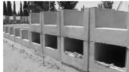
כוכים מונחים בלי חיבור של מלט

במקומות אחרים, וככתמונה הבאה, אפשר לראות שמניחים אמבטיה ליד אמבטיה, ואין שם חיבור או הדבקה, ולכן נראה שהסיד מונח רק מבחוץ ליופי או קצת לחיזוק, אבל לא צריך כלל את החיבור הזה.