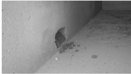
כך עם נקב קטן

שלא נצרפו בכבשן, לא יהיו עדיפי מכ"ח, כ"כ לי הגר"י פישעוץ, ועוד ציין לקה"י (שבת ס"י כו) דדן מהו השיעור של כלי עץ הבאין במדה המציילין בצ"פ, שגם לא התפרש בהם, ולמד דינם מהיסוד המבואר לגבי כ"ח ע"ש, ובמאמר המלא הבאתי עוד מהמו"מ עמו בזה.