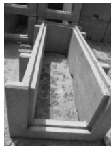
כוח כאמבטיה בלי תחתית

ענף ג: דין האמבטיות שהתחתית היא נפרדת צורה נוספת של האמבטיות מבטון, היא אמבטיה שבלי תחתית, ראה תמונה הבאה: