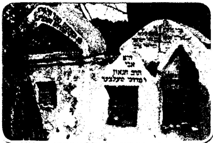
קברו של ה"חיי אדם" בבית הקברות הישן בווילנא שלדאבוננו נחרב

היתה שמועה כי ר' חיים התבטא על כך בהקפדה, ושאל באירוניה: "באיזה ספר