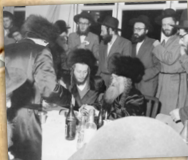
רבינו הבית ישראל זי"ע בנישואי ב"א כ"ק מרן האדמו"ר מגור שליט"א

(אגרת לגה"ח רבי חיים מאמל ז"ל אודות השידוך של כ"ק מרן אדמו"ר שליט"א עם בת הגה"ח רבי מנחם מנדל וויין ז"ל. מפורסם לרגל יומא דנשמתא כ"ג באדר - תש"ח לשולח הנכבד אי"ק)