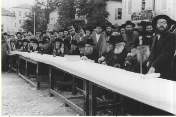
רבינו הב"י במעמד הנחת אבן הפינה לבנין פנימיית ישיבת 'שפת אמת' - א' אייר תש"י; נואם הגר"י פלקסר

עוד בחיי ה'אמרי אמת' נמנה ר' יצחק על מקורביו ואנשי סודו של כ"ק מרן אדמו"ר בעל ה'בית ישראל' זי"ע.