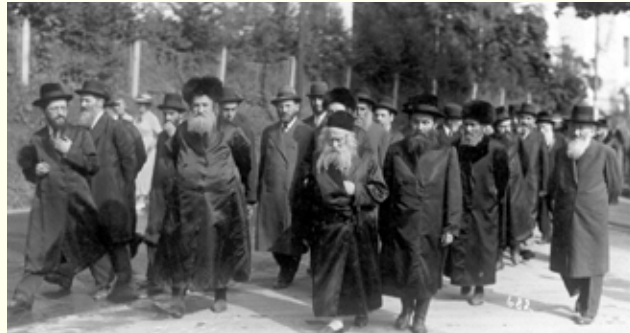
רבינו הבית ישראל לצידו של אביו רבינו האמרי אמת ביערות מאריינבד. נראים עוד: הרה"ק רבי חנוך גד מפילץ והרה"ק רבי מאיר אלתר הי"ד

על פי הספרים: אדמו"ר גור (עמ' קכח ולהלן) בית ישראל להבה (עמ' שג)