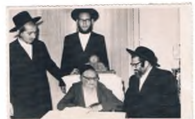
גאב"ד טשעבין זצ"ל בערוב ימיו

רבינו היה רגיל לציין שהגאון מטשעבין זצ"ל סובר (דובר מישרים ח"א סימן נ"ה) שאסור להכניס מים למקפיא בשבת, וכן לשתות מים שהופשרו מקרח בשבת משום איסור 'נולד'. אבל רבינו העיר על כך, ואמר שאיסור נולד שייך בדבר שתחילת ברייתו היה כך והוא הופך אותו למצב חדש זהו איסור נולד, אבל דבר שהיה מים והוא מקפיא אותו שיהי' קרח לא נחשב לנולד כי לא התבטל כאן המעשה הקודם וגם דבר קפוי ראוי למאכל עכ"ד. ואף הוסיף לומר, ששמע ממרן החזון איש להתייר, ואמר שאצלם ב'קוסבא' היה המנהג פשוט שאם רצו להקפיא דבר היו שמים על החלון מול הכפור והיה קופא (ונאריך עוד בעז"ה במקומו).