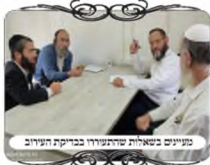
מעניינים בשאלות שהתעוררו בבדיקת העירובין

לבדוק, ובכל זאת היה לא מעט דברים לבדוק. דבר ראשון יש צדדים אחרים לעיר שבהם הערבים אינם סמוכים, ושם יש חלקים שאין גדר אלא צורת הפתח מעמדי חשמל וכדומה. וגם באזורים שצמודים לעיר הפלסטינית, אחרי בדיקה מקרוב התברר שיש כארבעים מטרים שאין גדר מסודרת.