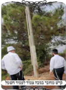
קיש מוכר בגובה צמוד לעמוד חשמל

עמוד מוצמד לעמוד חשמל בגובה, וכשהאריכו את העמוד בצד במקום אחר שהיו צורות הפתח, אידע שינוי בכביש הבטחון העובר סמוך