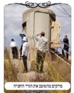
בדוקים מהתושב את הגדר ההרשמה

לאחר תיאום הגענו אל הישוב, עכרנו יחד עם הרב ועם הבדוקים העוסקים במלאכה, ובמקומות שהיו שאלות, הצענו אותם לפניהם עם המקורות, שיראו אם ובמה מומלץ לשנות, ולתקן יותר טוב. בעיר זו יש הרבה חלקים עם גדר בטחוניות, כיון שהם צמודים לעיר של פלסטינים שיצאו ממנה כמה מחבלים. ולכאורה היה סביר שאין מה