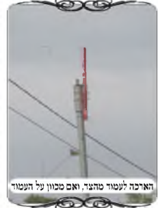
האריכה לעמוד שהעיר, ואם טבחו על העמוד

שאלו המשתתפים, כיון שהקרש צמוד לעמוד חשמל, וגם היה עוד קרש צמוד מאחוריו, נאמר שהם המשך של העמוד עד הקרע. והתשובה היא כפי שכבר הבאנו כמה פעמים בשם רבני זמנינו, שאי אפשר לומר המשך לעמוד אלא בדבר שממשיך מעל גביו של החלק התחתון, שאז המשקוף נחשב מעל העמוד שעל הקרע, אבל בדבר שממשיך מהצד של העמוד, הרי זה עדיין מן הצד, המשקוף אינו מעל העמוד שמתחיל בקרע, אלא על דבר שנמצא מצידו, וא"כ זה פסול [וגם למקילים בעמוד עקום, אך לא בשני עמודים זה בצד זה].