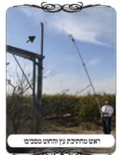
ראש מחתיכת עץ והחוט מסביבו

אבל בעמוד שהוא הראה לנו לא היו מסמרים למעלה, או שהם היו נופלו, וכעת החוט היה קשור מסביב לחתיכת העץ, כיון שהוא היה בבעיה איך לקשור את החוט. אמרנו לו דוקא הדבר הזה הוא לא קטן, הוא