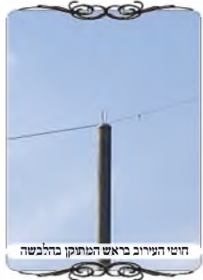
חצוי העירוב בראש המותקן בהלבשה

בגליון זה יש לנו הזדמנות להודות לה' על חסדיו המולים אותנו תמיד, ובפרט בשבוע זה, בשעה שהיינו בעבודות בשטח, והרכב של העירוב שקע בביצה עמוקה שלא היה אפשר להיחלץ ממנה, ויחד עם זאת נדלקו הקוצים תחתיו מחום המנוע. העובדים ראו