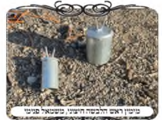
מיניו ראש הלבשה חיצונית, שנושא פנימי

יש הלבשה חיצונית, שהיא עם צינור רחב [בקוטר 4 צול], והיא מועילה כמעט תמיד, אבל יש בה חיסרון, שאם העמוד צר והראש רחב, הוא מתעקם ונוטה לצד, ולפעמים עד כדי שהחוט נמצא מחוץ לרוחב העמוד. אבל יש סוג אחר של הלבשה פנימית, דהיינו שהחלק המתלבש נכנס ומושחל לתוך הצינור של העמוד, ואז הכובע מכסה על העמוד בצורה שווה, כאילו זה ראש מקורי שמחובר לעמוד. אבל יש עמודים שאינם