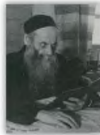
רבי איסר זלמן מלצר "האבן האזל"

בחיבוריו של רבינו הוא הרבה מספרי אבן האזל, ונושא ונותן בדבריו. ראה בדרך אמונה הלכות שמיטה (פ"י ה"ט בהה"ל ד"ה ודין) ובהלכות מעשר (פ"ג הכ"ד ד"ה המוצא, ובהה"ל שם אות י"ג) שמביא מדבריו בחלק ג' הלכות קנין, וכן בדרך חכמה בהלכות בית הבחירה וכלי המקדש מביא פעמים רבות מחידושי אבן האזל על הלכות עבודה.