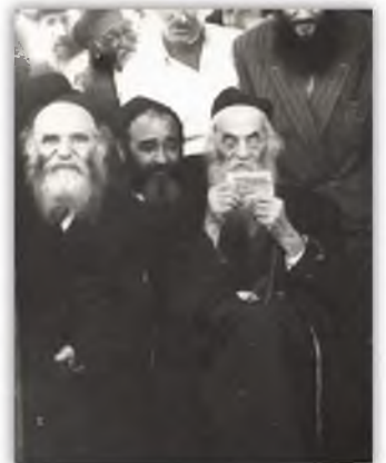
רבי איסר זלמן וחתניו - רבי יצחק בן מנחם ורבי אהרן קוטלר

סיפר רבינו שכשלמד בישיבת לומז'א בפתח תקוה, שמע תקופה מסוימת שיעורים ממרן הרב שך, והוא היה מזכיר הרבה מהרב מברסק ומרבי איסר זלמן. ופעם אחת הוא אמר שיעור שלם שכולו דברים מרא"ז, ולא הוסיף עליו כלום!