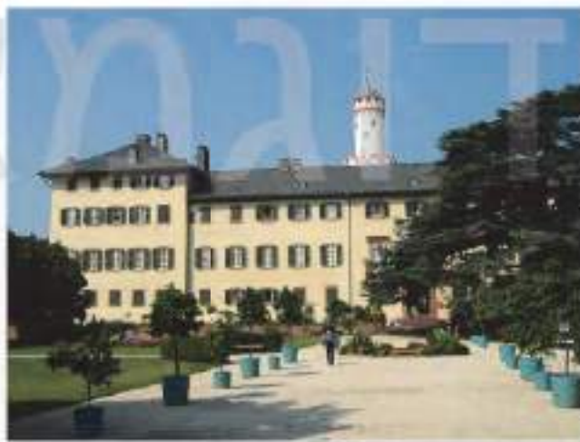
'לאנד ראפן שלום' - ארמון המלוכה בבאר האמבורג, סקום בו התאכסנו כל הרחמים ושיר המלוכה