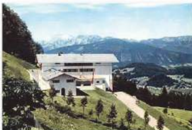
ביתו של הרשע יצ"ש, שם הנה והשתתף את שיטתו הנוראה.

טויטער צוזאמענעלויף איז'ן בערלינער וואקאל ביים אנקומען פון רבין