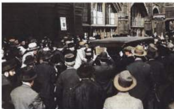
קהל רב סקבל את פני כ"ק מרן זי"ע בבית הנתיבות במערלין

לאחר חג השבועות הביע כ"ק מרן זי"ע בפני אנשי הבית כי ברצונו לנסוע ל'בערלין', לדרוש ברופאים עקב חוליו על עיניו הקדושות, אנשי הבית ניצבו מיד הכן למלאות את רצון קדשו ולחכיך את כל צרכי הנסיעה, אבל בעמקי הלב הרגישו שעניין הרפואה הוא רק אמתלא לנסיעה, וכי הנסיעה היא לצורך מטרה אחרת ונסתרת.