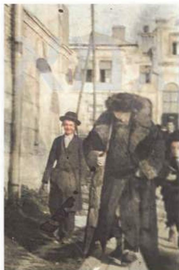
כ"ק מרן זי"ע הולך על הקלאטקל ביום הפורים, בדרכו מהחוף לבית הכנסת.

אם עד היום היתה הדלת פתוחה להמון בני ישראל שצבאו על פתחו, וכ"ק מרן זי"ע ישב שעות רבות למלאות משאלות עם סגולה, הרי שלפתע החל כ"ק מרן זי"ע למעט בלקיחת פתקאות וישב סגור ומכונס בחדרו.