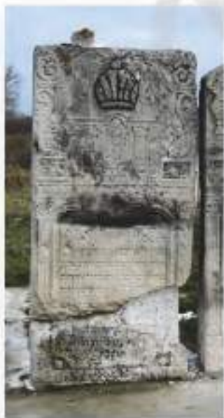
ציון המצוינת של כלל מרן מחריי זי"ע

"אהרן יהושע זאגט איהם עפעס שטיל אויפ'ן אויער, און דאן הויבט דער רבי אן זיין ענטפער: איך זאג, המן האט בלויז געוואלט די אידען שלעכטס טוהן, און דער רשע טוהט טאקי אידען אלדאס ביז, קודשא בריך הוא וועט העלפען! דער רשע וועט האבען א מופלא! פריהער אדער שפעטער! מיר וועלען איהם מכניע זיין! זאגט די אידען אין מיין נאמען, אז לאנג וועט שוין אזוי שלעכט נישט זיין! מיר וועלען געהאלפען ווערען [אהרן יהושע לוחש משהו באוזנו, ואז מתחיל הרבי את תשובתו: אני אומר, שהמן רק רצה להרע ליהודים, אבל הרשע הזה באמת עושה רע ליהודים, הקב"ה יעזור, שיהיה להרשע מופלא, במוקדם או במאוחר, אנו נכניע אותם. אומר ליהודים בשמי, שלא זמן רב יותר מדי יהיה רע כל כך, לבסוף נושע]."