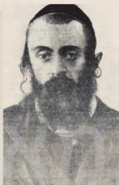
דער בעלזער רבי, וועלכער איז דער קראנק און האט שוין גענוג גענוג צו שווימען זיך אין בערלין.

בערלין, יוני 5. — דער יונגער בעלזער רבי איז אנגעקומען סיטווא קיין בערלין, כדי צו זעהן זיך מיט א גרויסען דאקטאר. דער רבי איז שטארק קראנק. אין דעם אידישען קווארטאל פון