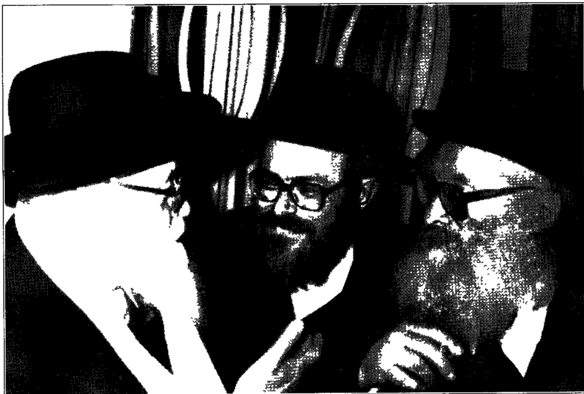
רבינו בשיחה עם רבי יוסף שלום אלישיב, ביניהם רבי יצחק זילברשטיין רבה של "רמת אלחנן"

אור־אז גמר רבינו אומר, לקיים בנפשו את דברי התנא "וקנה לך חבר", כשהוא