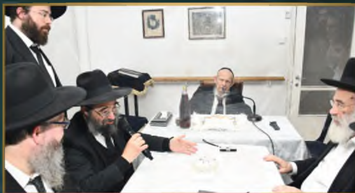
סיום כתיבת ספר תורה לכבודם של ראשי ישיבת סלבודקא על ידי בוגרי הישיבה מחו"ל