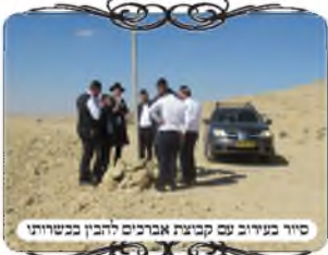
סיור בערים עם קבוצת אברכים להבין בכשרות