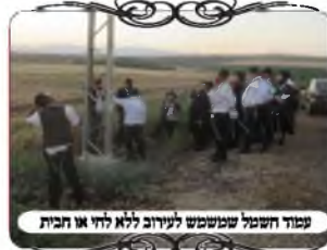
קבוצה חשבה שיש להעביר את החוט לאחור או חזית

לפני הסיום נערך סיור ביישוב הסמוך לטבריה, בהשתתפות עשרות האברכים שלמדו במסגרת השיעורים, כדי לראות מקרוב במוחש את ההלכות, ולעמוד על הדרגה של היישובים, שלפעמים יש בהם בעיות של עיקר הדין. בסיום התחלנו לעבור לאורך קו העירוב, ראינו עמודים שהתעקמו, ועוררנו את האברכים לדעת האם זה פסול, או רק לא מהודר. לאחר מכן היה חוט שעובר בתוך עץ, ולמדנו להגדיר את הבעיה, האם זה פוסל לגמרי או רק בדיעבד, האם הענפים מנדנדים את החוט ברות, או מזיזים את החוט לגמרי. הגענו למתחם שמשכירים אותו לקבוצות חרדיות, וראינו שהוא מנותק במקום אחד מהעירוב של הישוב.