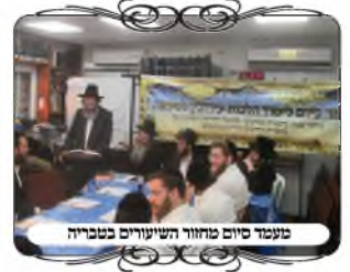
מעמד סיום מחזור השיעורים בטבריה