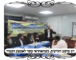
רב מושב הזורעים, כשהוא דורש קשר לאמצע העמוד

עוד הביא הרב מקרה שאחד מהתושבים הקיף את החצר שלו בגדר, ולא נגע בעמוד, אבל זה פוסל את העירוב כי הוא נמצא בתוך חצר מוקפת בפני עצמה. רואים כמה צריך עירונות להרבה הלכות. האחראי לומד רק איך קושרים על הוי שבראש העמוד, אבל לפעמים יש דברים אחרים שיכולים לפסול בסיום דבריו, האברכים נהנו מאוד מההיכרות עם תנאי המושב.