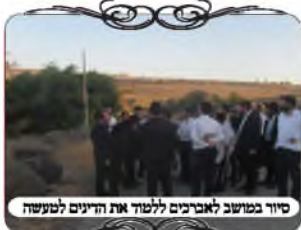
סיור בשטח לאברכים ללמוד את הדינים למעשה

בשבוע זה זכינו בס"ד להשלים את מחזור השיעורים בעיר טבריה. מתחילת המחזור לפני ארבעה חודשים, עמלו עשרות אברכים על לימוד הלכות עירובין בצורה יסודית ומעשית, בהיקף ידיעות עצום. כל שבוע היו מתאספים כשלושים אברכים מרחבי העיר אל בית המדרש המרכזי בשכונת נוף כנרת פוריה, לשמוע את השיעור השבועי. כל שיעור היה במשך שתיים של לימוד בהלכות המורכבות של עירובין, עם ביאורים מעמיקים וסברות הפוסקים, על מגוון מקרים שנמצאו בבדיקת עירובים ברחבי הארץ, והאברכים דנו והתווכחו עד שהבינו כל נושא ונושא כהלכה. במשך כל השבוע התקיימו בכוללים דיונים בהלכות שנלמדו, וכך הנושא נכנס לנחלת כלל אברכי השכונה ותושבי העיר כולה.