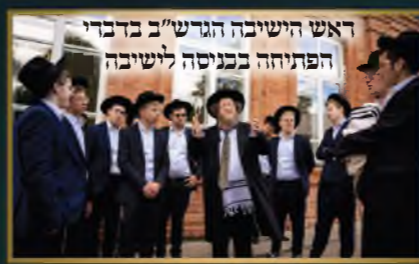
ראש הישיבה הגרש"ב בדבריו הפתיחה בכניסה לישיבה