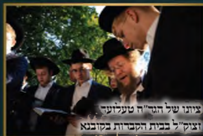
צינו של הגר"ה טעלזער זצוק"ל בבית הקברות בקובנא