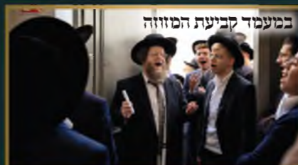
במעמד קביעת המזוזה