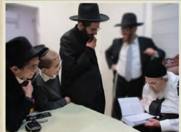
מרן הגאון רבי ברוך מרדכי אזרחי שליט"א בעיון במהדורה החדשה ונתינת הסכמה

• למבקשים, ולתלמידיו שומעי לקחו – ברוח הדברים שנשמעו מפי קדשו •