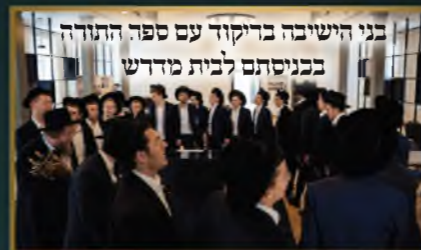
בני הישיבה בדיקוד עם ספר התורה בכניסתם לבית מדרש