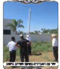
יחד עם האברכים בשיעור העירוב בישוב

בימי בין הזמנים ניצלנו את הימים הפנויים מסדדי הלימוד הקבועים, ולקחנו את האברכים שרצו להשתתף בבדיקת העירובים בישובים, לראות מקרוב האם הבעיות מצויות, או שמא זה סתם סיפורים ח"ו. התחלנו באחד הישובים בדרום, ישוב שכולו אנשים שומרי שבת, ויש גם רב חרדי שרוצה מאוד שהעירוב יהיה טוב, והוא אמר שיש קטע בישוב שסמכו על תל המתלקט, והוא חושש שהוא השתנה קצת, ואולי לא כדאי לסמוך עליו, לכן ביקש שניתן הצעה להעמדת עמודי עירוב במקום התל.