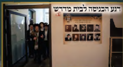
דגל הכניסה לבית מדרש