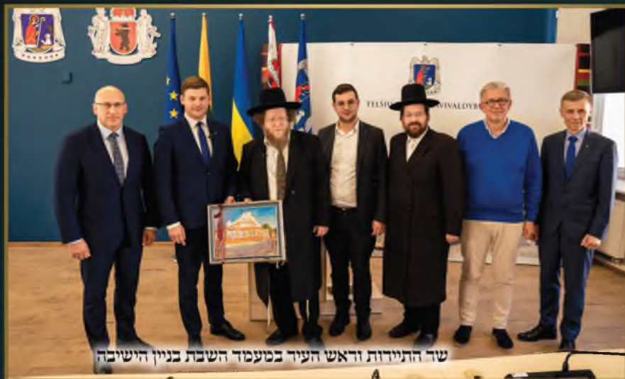
שר התירות וראש העיר במעמד השבת בניין הישיבה