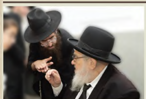
המחבר, במשא ומתן הלכתי עם בעל ה'ברכת אברהם' זצוק"ל