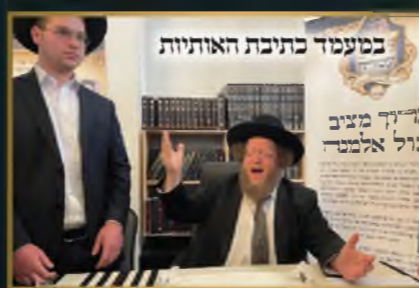
במעמד כתיבת האותיות