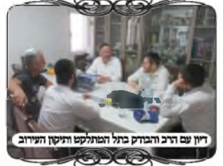
דיון עם הרב הבדק בתל המתלקט התיקון העירוב

לאחר מכן ניגשנו לבדוק את התל, שארכו כשלוש מאות מטרים, וכאמור היו קטעים שהשיפוע היה חלש מדי, היו גם קטעים שכל גובה התל היה פחות מי טפחים, ולא היה שייך להכשיר אותו כלל. לאחר הסיוור בשטח נכנסנו לבית רב המושב, והסברנו שבאמת חייבים לעשות עמודים. הרב אמר שאין לו תקציב אך ניסה לגייס משהו מהמושב שיעשה לו עמודים בהתנדבות, ועוד ישיג פועל שיעזור, ומבקש שמוקד העירוב ידרך וישגיח, בתקווה שייצא מזה עירוב מהדר לגמרי. אמרנו לו שמהדר זה לא יהיה, אבל לפחות שיהיה כשר, כי במצב שראינו אין להם עירוב כלל.