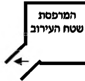
המרפסת שטח העירוב

אבל לאחר התבוננות בתמונה מצאנו שיש אפשרות להתיר אותה ע"י עומד מרובה ולא ייחשב לפירצה בקרן זווית כיון שבמדרגות יש מעקה משני הצדדים, וא"כ אם נמשך את הגדר של המרפסת [העומד] בקו ישר, הוא יפגוש במעקה שנמשך במדרגות עד למטה, ומבואר בחזו"א שעיקר הפסול של קרן זווית הוא, שאין העומד פוגש במחיצה כנגדו, וכיון שכאן הוא פוגש בגדר כלשהי זה כשר. אבל יש להסתפק, כיון שבסוף