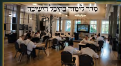
סדר לימוד בהיכל הישיבה