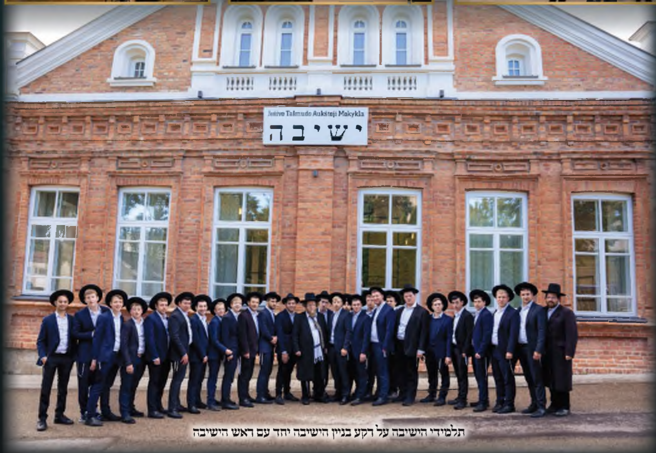
תלמידי הישיבה על דקע בניין הישיבה יחד עם ראש הישיבה