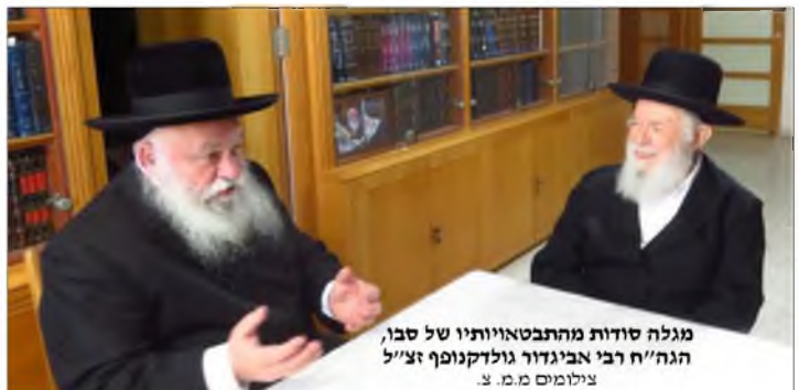
מגלה סודות מהתבטאויותיו של סבו, הגה"ח רבי אביגדור גולדקנופף זצ"ל