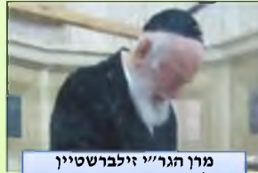
מרן הגר"י זילברשטיין ב'סליחות' י"ג מידות בעשרת ימי תשובה בשנה זו

למרות שמדובר בקטעים העוסקים בדמעות, היתה לנו הרגשה שיש סיבה נוספת לכך.