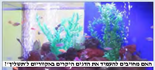
האם מחויבים להעמיד את הדגים היקרים באקווריום ל'תשל"ך'?

הרב השיב שאפשר לומר לו בבירור שאין לו כלל מה לחשוש, כיון שהדגים 'מחוסנים' כידוע מעין הרע, וגם ששומר מצוה לא יידע דבר רע.