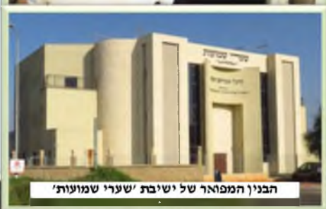
הבנין המפואר של ישיבת 'שערי שמועות'