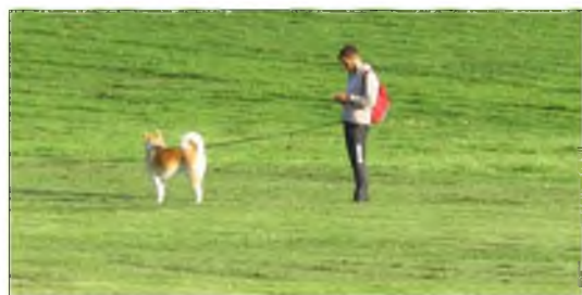
החגורה הקשורה בצווארו של הכלב מגבילה את יכולת-תנועתו. המשל המופלא על הייסורים הפוקדים אותנו

ברגע שהוא מבחין באדם חשוד, הוא מזנק אליו, ומותח את החגורה שסביב צווארו עד סופה. כאשר הכלב מגיע אל קצה החגורה, הוא אינו יכול להמשיך בריצתו ולו מילימטר אחד נוסף. מה שכן הוא יכול לעשות, זה לרוץ בחזרה, ולמתוח את החגורה עד לקצה השני של הכפר. וגם שם,