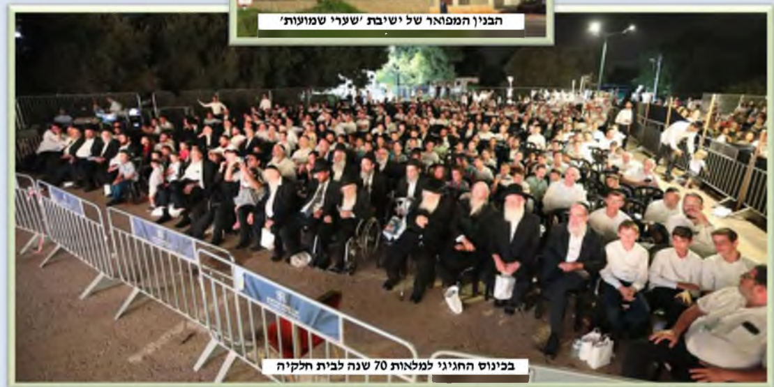
בכינוס החגיגי למלאות 70 שנה לבית חלקיה