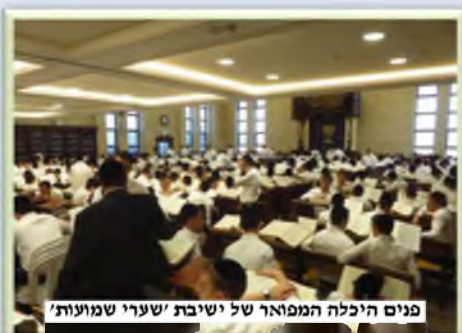
פנים היכל המפואר של ישיבת 'שערי שמועות'

הבאתי לו, ולאחר שבירך על המים אמר: 'תלכו מחר לשטח ותרססו בריסוס הכי-פשוט. אבל, בכל פעם לפני שאתם מרססים תכניסו לתוך מכל הריסוס קצת מהמים שבבקבוק. ובזכות אבינו מורנו ורבינו תהיה ישועה גדולה