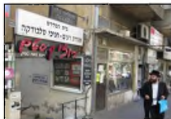
בית הכנסת 'אגודת רעים' ברחוב רבי עקיבא

חוש הריח), לא בדיוק נדע ונבין את חוכמתו האיסופית של הקב"ה שזואג לכל בריותיו ורוצה שלא תהיינה רעבות, ו'משתיל' בהן תכונות פלאיות, שאיך שלא נסתכל עליהן, הן פלאיות ברמה כזו שאנחנו כבני-אדם לא מסוגלים להבין כיצד הדברים פועלים.