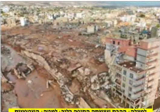
למעלה: ההרס שעשתה הסופה בלוב; למטה: השטפונות בארץ ישראל, בבנייני רמת אלחנן, בעיצומו של הקיץ

אלא שעד מהרה טיפס מספר ההרוגים ל-6,000, 8,000, וכך הלאה... בתוך זמן קצר דיברו השלטונות על ההשערה הוודאית, שנתמכה על ידי התקשורת בלוב, שמספר ההרוגים יעבור את ה-20,000.