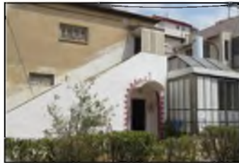
הבית הצנוע בו גידלו רבי אליעזר רובינשטיין ורעייתו את 8 ילדיהם

● הסיפור הזה הוא ממש בבחינת הלא-ייאמן; החתולות, שידעו את דבר העצמות שתחולקנה להן עוד מעט, המתינו לבעל-הבית בפתח בית הכנסת בו התפלל! מישוהו יכול להסביר לנו כיצד הן ידעו שהוא בעל-הבית שישליך את העצמות לחצר? וכי הן עקבו אחריו? ואיך הגיעו לבית הכנסת? - גם אם ננסה להסביר (שהן עשו זאת ע"י