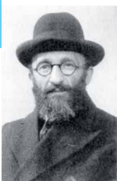
הגה"צ רבי אליהו אליעזר דסלר זצ"ל

הזה לתועלת האדם, וכתוצאה מכך מתרבה גאות האדם כאילו הכל בידו ניתן ולא יבצר ממנו כל דבר. השקפות אפיקורסיות על עליונות כח האדם הולכות ומציפות את כל העולם כולו, עד כדי יציאה בריש גלי במלחמה כנגד האמונה והמאמינים בד' ותורתו, זהו עיקר תוכן הגלות של המלכות הרביעית. ולכן עלינו לדעת שזהו הנסיון שבו צריכים ישראל לעמוד בגלות זו.