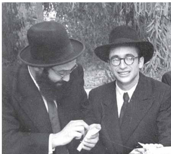
תמונה נדירה משמחת נישואי הגר"נ נבנצאל זצ"ל שנלב"ע בחודש האחרון

"איננו קבלנים ליישב קושיות. אם למרות כל מה שאמרנו, אנחנו עדיין מתקשים, עלינו לזכור זאת", אמר לא פעם. אסור לנו לרמות את עצמנו ולחשוב שהגענו לחקר האמת.