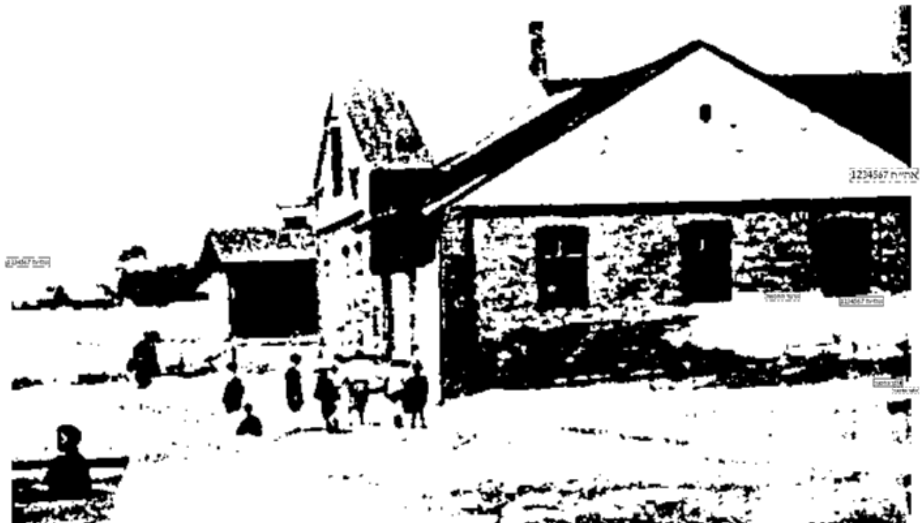
בנין המקוה בקאלושין