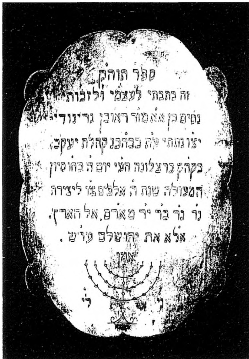
טס כסף שצורף לספר התורה

"ספרי תורה קדושה והדורה ולבשי כסות השחורה, כי מפרשי אמריך ברורה נפלו באש המדורה. שלשה חרשים פשטה אש תבערה בק"ק בנ"י [בקהילות קודש בני ישראל] בגלות ספרד המרה, מר"ח [מראש חודש] תמוז שנת אלף שלש מאות וכ"ג לחרבן, צרה ותוכחה נתכה, כמהפכת סדו"ע [סדום ועמורה] נהפכה. אוי לנו על קהלות הקדוש[ות] בערי ממלכת קשטיליא טוליטולא שביליא מיורקא קורדובא ואלנסיא ברצלונה ארגוואן גרנאדה ובששים ערים סמוכים להם