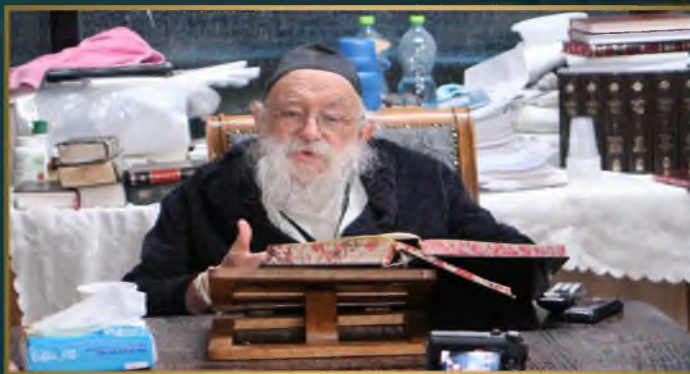
"השיבה לצעירים עפולה" שע"י הקהילה התורנית גבעת המורה, בבחינה אצל ראשי ישיבת "נחלת הלויים" בחיפה