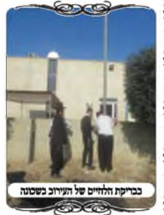
בבדיקת הלחיים של העירוב בשכונה

הוראה זו קיימת גם כלפי עמודי תאורה יחזקים המצויים כיום, שיש להם התרחבות בחלק התחתון, והזכרנו כמה פעמים שאפשר להחשיב את החלק