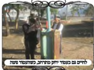
לחיים גם בעמוד ירוק מתרחב, כשהחוט נשחל

אבל בחלק מהמקומות הבעיה היתה אחרת, כי בעמודי החשמל [העגולים בעמודי תאורה] אין אפשרות לחבר אל העמוד בהכרה או בהלחמה, כיון שזה נחשב כפגיעה בנטייתו ועלול לגרום קנס ח"ו. לכן מה שהתחזקן עשה, הוא קשר חוט ברזל שזור סביב לעמוד והשחיל אותו בצד האחורי של הלחי [ע"י חיבור של צינור קטן שהלחים לכל לחי