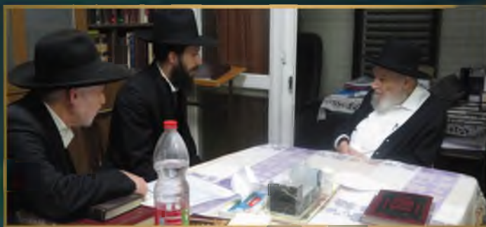
מרן ראש הישיבה הגר"ד פובדסקי שליט"א