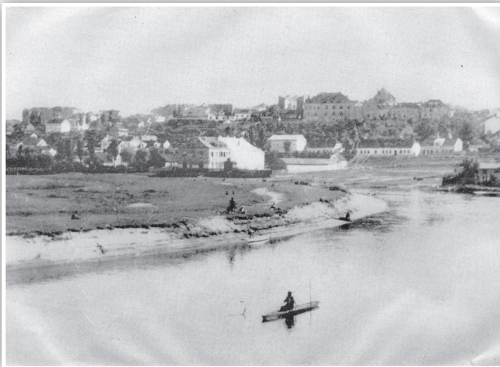
עיירת לומזה על גדות הנהר "נארווע".

אביו רבי אברהם יוסף התפרנס מיגיע כפו בעשיית שמן פשתן והיה עוסק בתורה בהתמדה גדולה, תוך כדי עבודתו בידיו היה עוצר את השמן וספר פתוח לפניו.