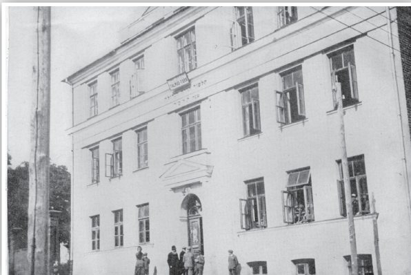
"בקטנותו התחנך ב'חיידר' המקומי" בנין הת"ת הגדול דעיירת לומזה

בקטנותו התחנך ב"חיידר" המקומי, כשהתבגר מעט עדיין בהיותו ילד מופלא הסמוך לאיש, מעט קודם הגיעו למצוות, שלחו אביו