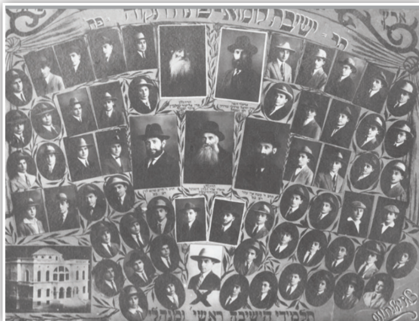
תלמידי ישיבת לומזה ורבניה בשנת תרפ"ח, במרכז התמונה רבינו

מפעם לפעם היה מדבר עם תלמידיו בערכי אמונה בה' ובתורתו, בהשגחה פרטית, שכר ועונש, תורה מן השמים ודרכי השגה בכבשוננו של עולם. למרות אמונה זכה שהיתה מובלעת בדמו, ידע והכיר את גווני החיים והמציאות מתוך ראייה מפוכחת, ולכן דאג להשריש בלבבות תלמידיו את יסודות האמונה במי שאמר והיה העולם, כדי שיהיו בידם כלים להתמודדות החיים. ובשיחה שמסר לפני תלמידיו ביסודות האמונה אמר בתחלת דבריו: "אני יודע שאתם לא צריכים זאת, אבל הרי אח"כ נפגשים עם כל מיני אנשים, ודע מה שתשיב וכו'" 276 .