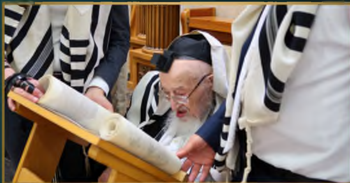
מדרן הגה"צ רבי שמעון גלאי שליט"א