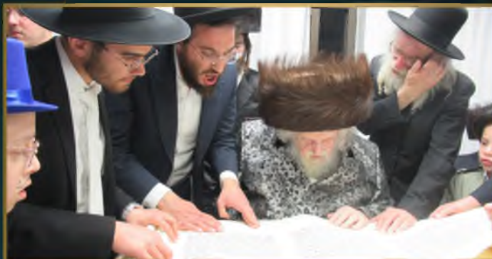
מרן פוסק הדור הגד"מ זילברשטיין שליט"א בדברי הלכה וחיזוק, לאחר תפילת שחרית בהיכל ביהכ"נ 'המרכז' דמות אלחנן