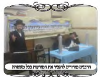
דברים טובים להבין את המודעות בכל משפחה

בשבוע זה התקיים מעמד סיום נוסף לעשרות אברכים לומדי השיעורים של הלכות עירובין למעשה, במחזור חורף תשפ"ד בקבוצות בעיר ירושלים. המחזור הנועד בתועלתו, שכולל לימוד כל ההלכות המורכבות הנוגעות כיום בעשיית עירובי הערים והשכונות, כולל דיני מחיצות וצורות הפתח, עמודים וחוטאים ולחיים, עירוב בפת ושכירות רשות, ועוד מגוון סוגי מחיצות, במסגרת זו למדנו גם כיצד לבדוק עירובים, על מה להסתכל, לא רק אם יש חוטאים אלא מה הכשרות שלהם, ואיך לדעת לדרג את רמת כשרותם, מה הדברים שחייבים מעיקר הדין גם בעירוב עירוני, ומה ההידורים שנוספו בעירובים השכונתיים. כל זה נלמד בליווי המחשבות של תמונות מהשטח, המוצגים באמצעות שקופיות, ובשילוב סיור מעשי בעירובי השכונות.