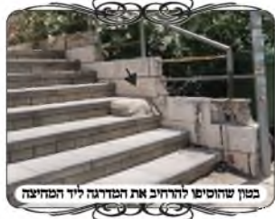
במון שהוסיפו להרחיב את המדרגה ליד המחיצה

במעמד שהתקיים בירושלים השתתפו גם רבנים ואחרים על כמה שכונות בירושלים, שחלקם נשאו דברים בהלכה ובפרקטיקה. הגאון רבי עזרא ילין שליט"א , רב העירוב בשכונת גבעת שאול, ביאר את המעלה הנוספת בהרבה עירובים שכונתיים בירושלים, שמסדרים שיהיה את הפתרון של עומד מרובה על הפרוץ על מנת לבטל את החשש לרשות הרבים לפי כמה שיטות ענין זה למדנו גם במסגרת השיעורים, שיסודו, בנוי על שיטת החזו"א שבעומד מרובה על הפרוץ נחשב "שם ד" מחיצות", ובנוי על שיטת חכמים וכו' אלעזר שסוברים שבכה"ג אין דין "אתו רבים ומבטלי מחיצות". [וכידוע שגם המשנ"ב כאשר תמה על המנהג להקל לעשות עירוב כשאין שישים ריבוא, כתב (בה"ל סי' שס"ד ס"ב) שיתכן, שהסתמכו על דעת הרמב"ם שפסק כשיטת חכמים הנ"ל. אלא שהמשנ"ב לא היה נוח לו בזה, וכתב שעדיין רוב הפוסקים חולקים וסוברים כרבי יהודה וכו' יוחנן, וחזר וכתב שבעל נפש יחמיר כי יש בזה גרר דחיוב חטאות ובהו הוסיף לצרף את השיטה של המשכנות יעקב בדעת חכמים, שכאשר יש צורת הפתח שמשלימה את העומד מרובה, יש ליה כוח של שם ד" מחיצות].