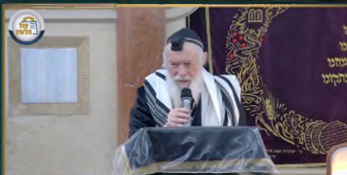
מרן הגד"מ גדינמן שליט"א בקריאת המגילה