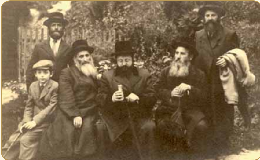
כ"ק האדמו"ר מסאדיגורא זצ"ל בנופש, הנער משמאל הוא האדמו"ר שליט"א

שיגר במכתב להג"ר צבי יחזקאל מיכלזאהן כמובא לפנינו: