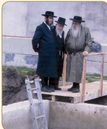
מפקח על בדיקת מקוה טהרה בברדיטשוב שבאוקראינה

הוא חורץ. "התמדתו היתה מופלאה, ולמעלה מכל מושג. לא היה שייך אצלו מושג של בטלה, וכל רגע בו לא עסק בהוראה, תפילה או שאר צרכים – היה קודש ללימוד".