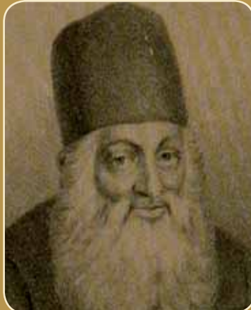
רבינו יהונתן אייבשיץ זיע"א

בתורתנו וזהו שמקיימין את העולם וזולת זה המתאווה לדברים אחרים אחרים ולא ישיגם ויבחר מחנק נפשו ויפול בדאגה וירד שחת ולכך לא מצאנו משבח ארץ ישראל ברוב זהב וכסף רק בדגן ובפירות המקיימין את האדם בבריאתו".