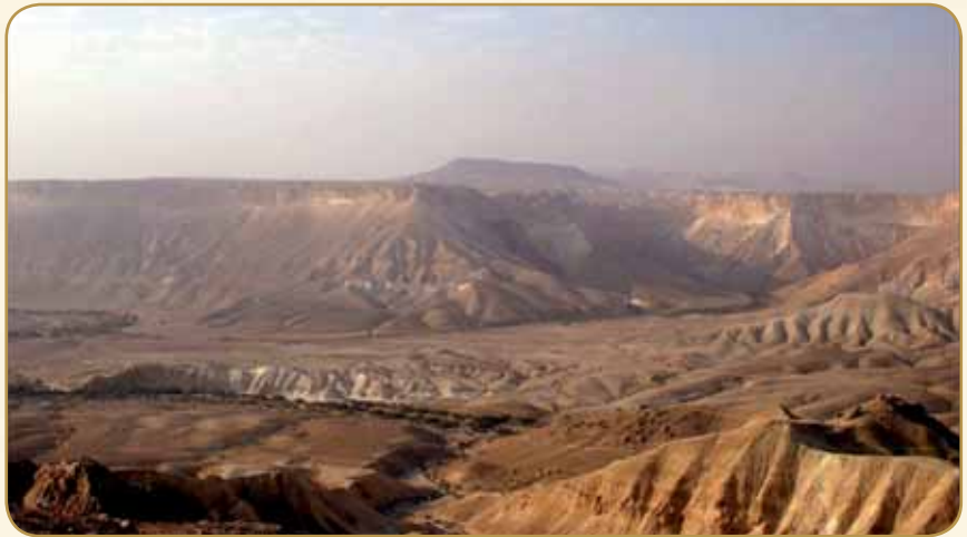
עמקי הערבה. האם שם אכן קיים זהב?

סיכומו של דבר הוא: לדעת הרמב"ן אין ולא היה זהב בארץ ישראל, ואף יעלה ביד מי למצוא זהב הרי שאלו כמויות קטנות ולא משמעותיות. ואילו לדעת בעל 'תורת המנחה' קיימים בארץ מרבצי זהב בדומה לברזל ולנחושת, מה שמשאיר את האופציה למצוא זהב בארץ ישראל פתוחה לכל מאן דבעי. ■