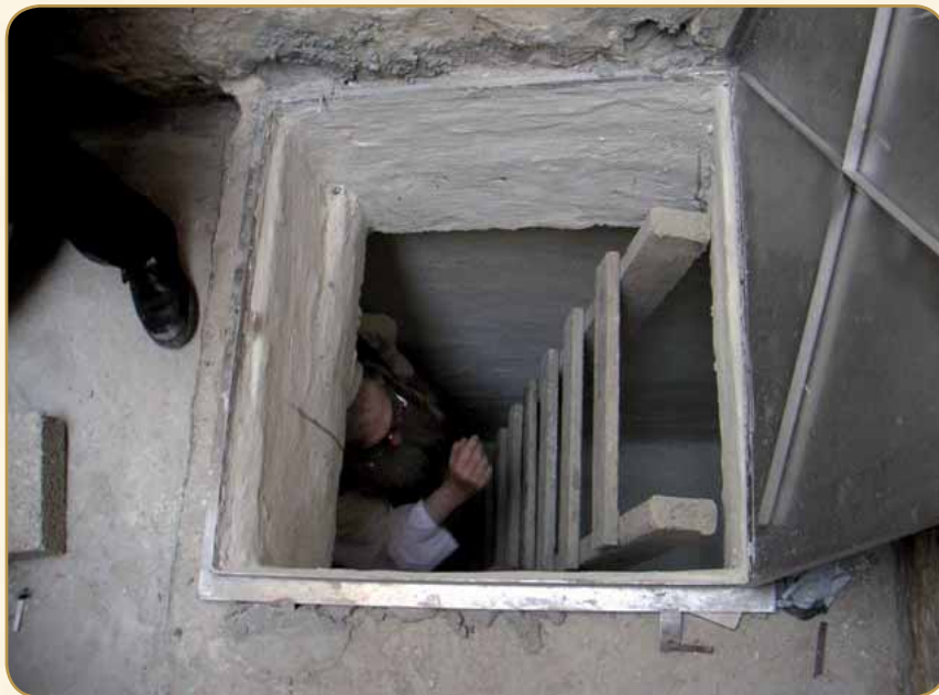
בדיקת מקוה טהרה

הוא פנה לאביו בשאלה זו, אך הוא הרגיעו שעשה כשורה. ואדרבה, מתשובת מכבי האש התברר כי בעצם כן מדובר היה בסכנה המחייבת חילול י"ט, ומנין לו לדעת שכבר קדמו משהו בדיווח על כך. נמצא איפוא, שכיון שעל פי ההלכה היה מחוייב הוא לצלצל, וא"כ אין לו לחשוש לאיסור בשוגג.