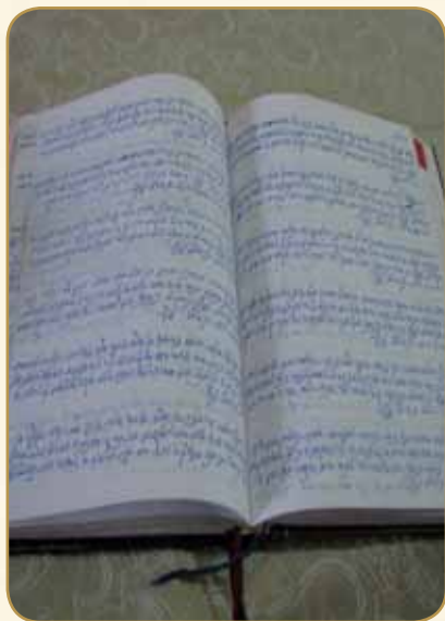
כתב יד קדשו בפנקס הבריתות בו תיעד 3000 בריתות שערך

כדוגמא לכך מביא הוא את שיטתו של אביו אשר התיר לפתוח את חוטי המתכת שלפפו את שקיות הלחם הפרוס בשבת. רבים החמירו בזה על