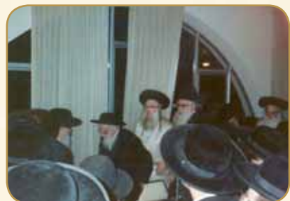
עם מרן הגרש"ז אויערבך זצ"ל בשמחת אחד מצאצאיו

או של לילה: "פשוט מאד, התשובות שנכתבו בלילה, מצוי בהם שהאות האחרונה במילה 'נמרחת' על הנייר, שכן לרוב עייפותו, פעמים היה מנמנם קלות תוכ"ד כתיבת התשובה, והעט היתה ממשיכה מאליה".