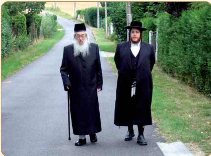
הנופש בצרפת לאחר הארוע המוחי