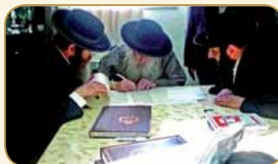
התמונה האחרונה מכתובת אותיות בס"ת שעתיים לפני התמוטטותו

כך, דבק הגר"מ כל כולו בתורה הקדושה, המית את הוויתו הגשמית והפכה לתורה. לא יפלא איפוא, שכאשר חלה הגר"מ ואושפז, ושרוי היה בתרדמה, לא פסק פיו מלמלמל "כשר, כשר, כשר".