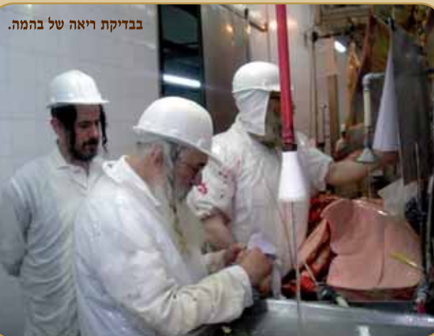
בבדיקת ריאה של בהמה.