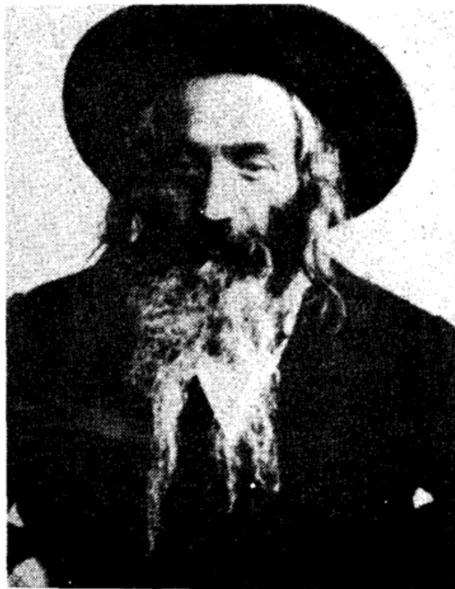
רבי ישראל צבי הלוי רוטנברג – האדמו"ר מקוסוני