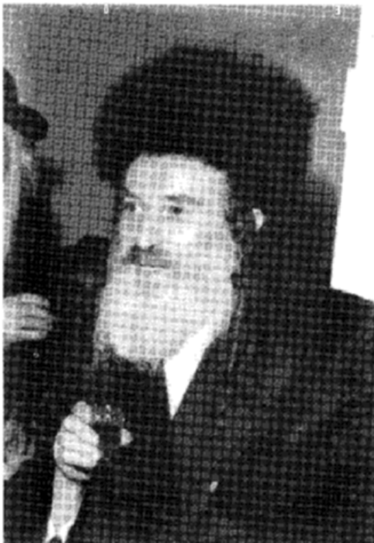
רבי יהודה אריה ליב אלטר