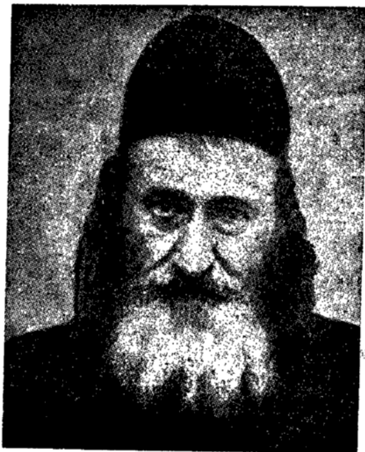
רבי מאיר דן פלוצקי