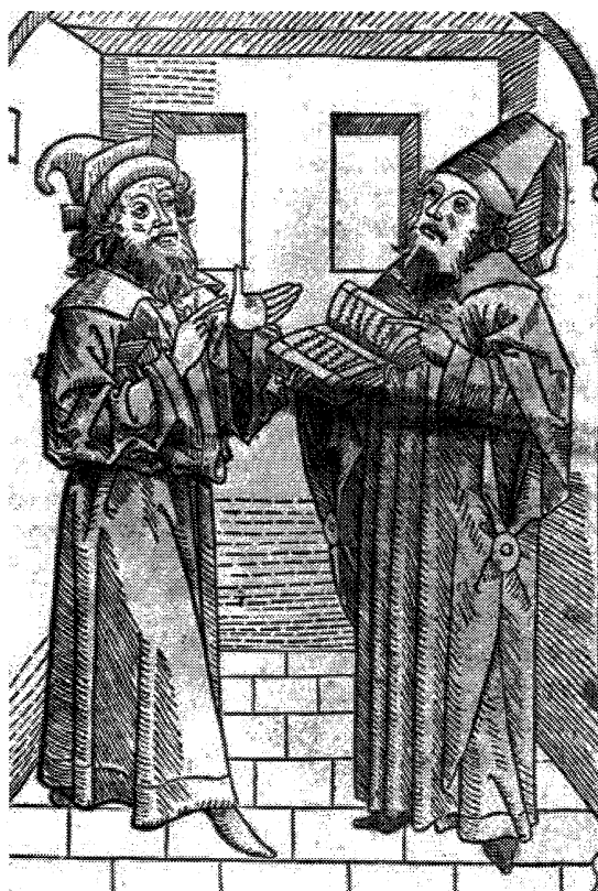
ויכוח בין יהודי (משמאל) ונוצרי (מימין)

גם רבי יעקב ב"ר מאיר רבינו תם, טען ש"יש"ו הנוצרי... היה בימי יהושע בן פרחיה". 15 בעקבותיהם קבע רבי יצחק בן יוסף הישראלי בעל 'יסוד עולם' תלמיד הרא"ש, שמעללי מייסד הנצרות היו בימי בן פרחיה: "יהושע בן פרחיה... בימיו אירע מעשה של ישו הנוצרי, כי הוא היה מתלמידיו של יהושע בן פרחיה". 16