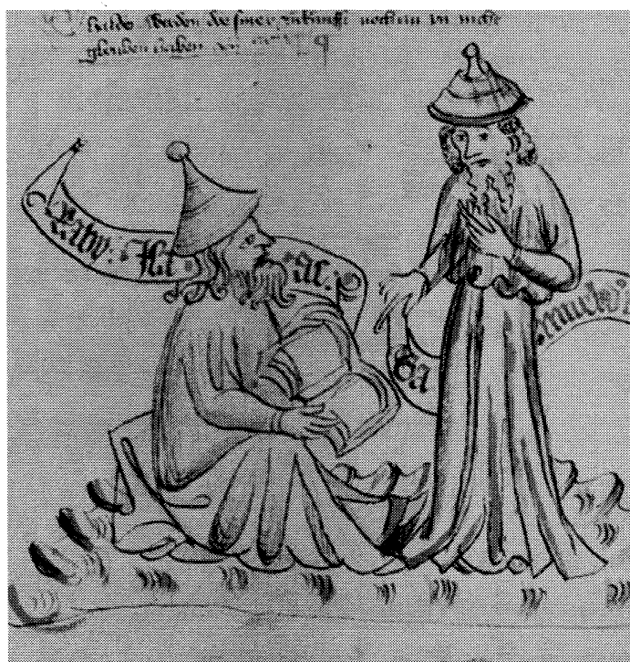
מומר לנצרות מתווכח עם יהודי באשכנז בימי ריט"ל מילהויזן

דברים אלה נאמרו בתקופה של רדיפות קשות בצרפת, ששיאן היה שריפת התלמוד בפריס וסיומן הטראגי היה גירוש כל היהודים מצרפת. האם באותה עת האמין ר' יחיאל, שמושלי צרפת הם באמת דורשי טובתם של היהודים, כפי שאמר? ודאי שלא, ודבריו נועדו לשכך את איבתם של המאזינים הנוצרים.