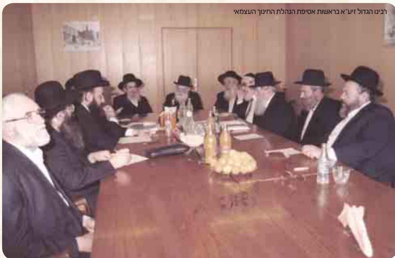
רבינו הגדול זע"א בראשות אסיפת הנהלת החינוך העצמאי