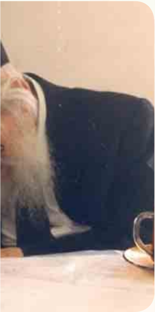
מסדר היום. הנה, מכתב של אחד מגדולי החסידות שהוא חריף פי כמה וכמה ממה שמתחולל היום.

הישיבה בעל ה"אבי עזרי" זיע"א. "פלגנים", "בעלי מחלוקת", היו הכינויים שהודבקו לציבור בני התורה באותם ימים טרופים. הגדילו לעשות עסקנים מסוימים שהעלילו על מרן זיע"א כי הוא גורם להצית מחדש את המחלוקת העתיקה בין 'חסידי' ל'מתנגדים'. בכך רצו אותם נבזים להטות את הוויכוח הענייני למחוזות אחרים, ולהתחמק מהתמודדות עם הטענות הצודקות. באותה תקופה כתב מרן זצוק"ל בדם לבו מספר מכתבים, בהם הבהיר שאינו מוחל למי שבדה עלילה זו כנגדו.