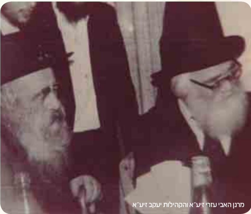
מרן האבי עזרי'ע"א והקהילות יעקב זי"ע"א

לא לדבר דברי התעוררות בעלמא, אלא להגיע למעשה ממש. תמיד עמד למול רבינו זללה"ה דמותו של רבינו החפץ חיים, שהיה קורא ותובע להתעורר למעשה ממש, למצות את הדברים, כך גם רבינו זללה"ה זי"ע"א. כי הרי כל אחד מכיר בעצמו תחלואי נפשו ונגעי לבבו, הוא יודע עד כמה הוא יכול להתעלות, והוא מפסיד את הכל בשביל דבר של מה בכך, בשביל איזו שיחה נאה".