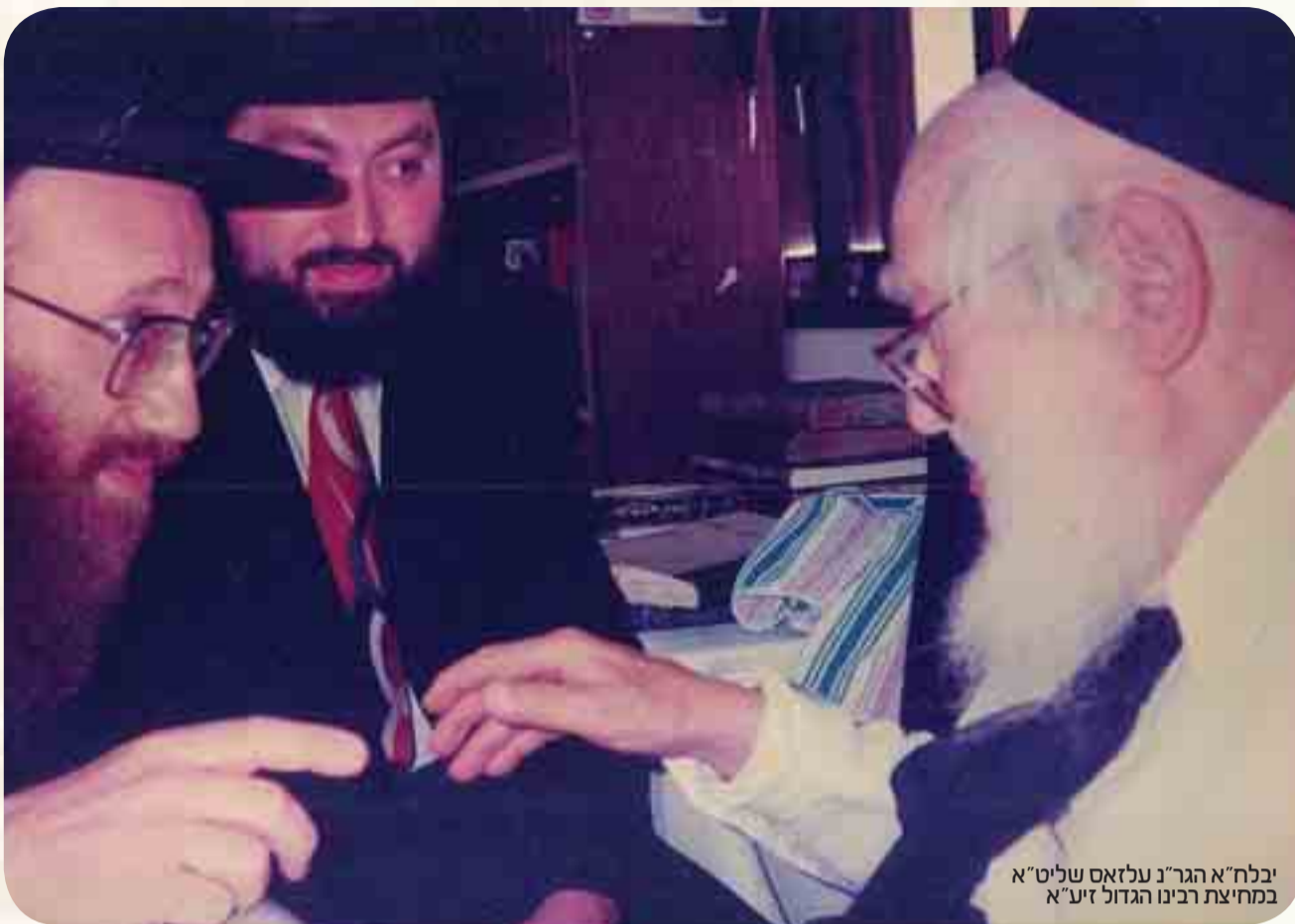
יבלח"א הגר"נ עלזאס שליט"א במחיצת רבינו הגדול זיע"א

בחוש. "ומצינו אצל אאע"ה, שהיה מכניס אורחים עצום, אך ההכנסת אורחים 'והוא עומד עליהם תחת העץ', לא היתה בגדר עמידה בעלמא, כי אם החדרת אמונה בו יתברך, שנתן לאורחיו שיעור באמונה. וכן זכינו לראות אצל מרן ראש הישיבה זצוק"ל, כאשר מעידים כל אשר זכו לקרבתו, שהיה מכניס אמונה בכל שומעיו, היה זורק אמונה, אמנם לא כולם קלטו את זה. אלו שקלטו, הוא הצל עליהם באמונתו היוקדת, אבל יש הרבה שאעפ"י שבאו עמו בקרבתו עדיין לא קלטו, אף שמתוך הרב גווניות שהיה בו, הם ראו גוונים אחרים, אבל לחסות בצילו - הם לא זכו..."