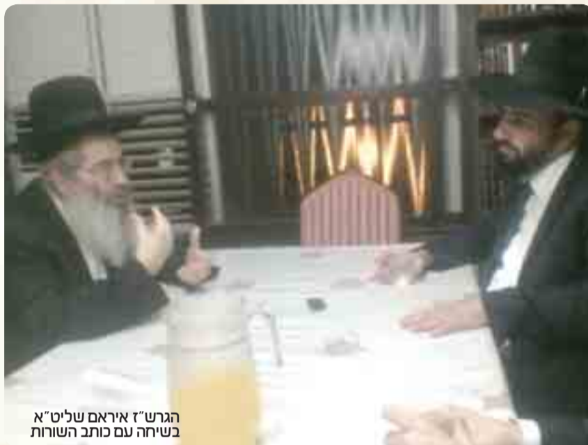
הגרש"ז איראם שליט"א בשיחה עם כותב השורות

פעם הלכתי עם מורי חמי הראב"ד הגאון הגדול שליט"א, בשנים הסמוכות לאחר הסתלקותו של ראש הישיבה זיע"א, והוא אמר לי כי מידי יום צריך לעשות קריעה מחודשת על לכתו של מרן הרב שך, אין לי מספיק בגדים לזה. וזה היה לפני למעלה מעשור שנים, כאשר המצב לא היה כזה גרוע כמו היום, אך הוא ראה את החורבנות שנהיו לאחר הסתלקותו ונחרד