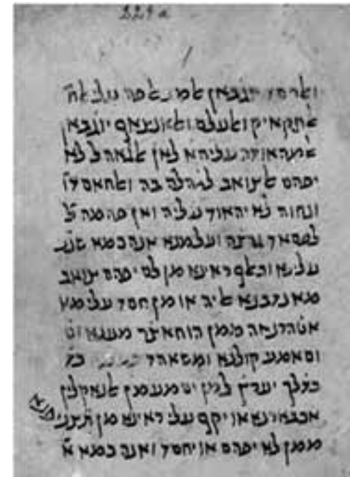
כת"י בודפשט, אוסף קויפמן, גניזה 229, עמ' 1

התפשטות ספריו כב' אגרת או מאמר תחית המתים 7 . אף ר' אברהם בן הרמב"ם העיד, ששני חיבורים של אביו הגיעו מהר לחכמים והם פנו אליו באגרותיהם ובשאלותיהם, 'ומתוך דבריהם ניכר לו ז'ל שהבינו ספריו ושמוחו בהם, ושמוח גם הוא שהגיעו דבריו ליודע אותם, שמחה לאיש במענה פיו, וכתב להם תשובת שאלותם והשיב על ספריהם לכבדם ולפארם כראוי להם' 8 .