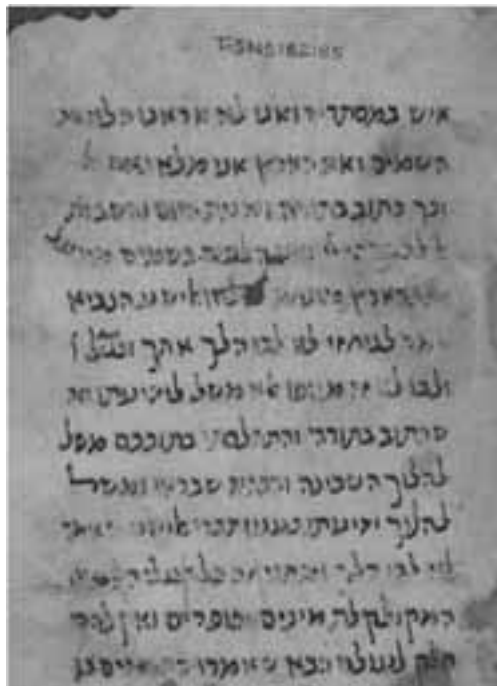
כת"י קמברידג', ספריית האוניברסיטה T-S NS 162.85

בסיום הדברים, לא נותר לנו אלא לקוות שיימצאו דפים נוספים מהחיבור המרכזי שנידון כאן, ואז, מלבד הדברים החדשים שיתגלו בהם, אולי נוכל גם להכריע באופן סופי את שאלת זהות החיבור, אחרי שביררנו בעזרת ה' את זהות מחברו.