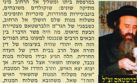
הגה"מ הלברשטאם זצ"ל

גדולים וצדיקים בוכים על כך ללא הרף. ואנא אנו באים!